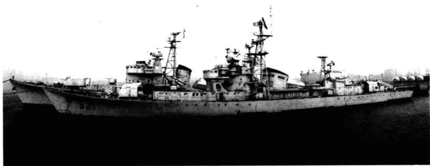
参加“3·14”海战的“531 鹰潭”号导弹护卫舰。