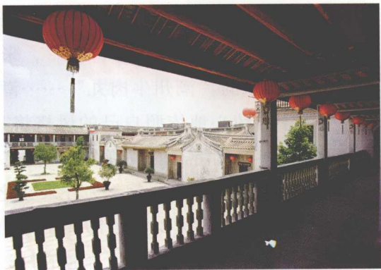
澄海隆都慈黄故居