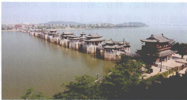
我国四大古桥之一——广济桥

幢是这时期建筑构件的代表，特别是石经幢端庄宏伟，堪称精品。由此人们可以想象当时建筑行业所达到的规模和水平。宋元时期，大量移民经闽入潮，汉文化经闽而来加速潮汕地区的开发，源源而入的移民具有先进的汉文化素质，官方重视兴学教化，使当地民众加快接受汉文化礼教风俗。潮汕人的汉化是潮汕人民系形成的基本条件。民系的形成也带动了潮汕建筑的地方特色的形成，这一时期，留下来的建筑实物有我国四大古桥之一——广济桥。该桥始建于宋乾道七年（1171年），集梁桥、拱桥、浮桥于一体，是我国桥梁史上的孤例。韩文公祠始建于北宋咸平二年（999年），是我国现存历史最悠久、保存完整的纪念韩愈的祠堂。潮州城内许驸马府，