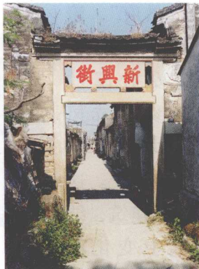
澄海樟林古港新兴街

进入清嘉庆年间之后，潮汕地区人口激增，清嘉庆二十三年（1818年），潮汕人口达到1 405 180人。人口激增，土地开垦却不多，加上自然灾害，潮州在清道光二十一年至二十三年连续三年发生大的水灾，韩江堤围多次被冲毁，淹没大片田园。官绅迫租利日紧，各种社会矛盾日益激化，清道光二十四年（1844年）至清咸丰四年（1854年），潮汕民众纷纷起义抗争，紧接着又爆发太平天国运动。这期间社会动荡，战事纷纷，经济大受影响，建筑营造必然回落到低潮。