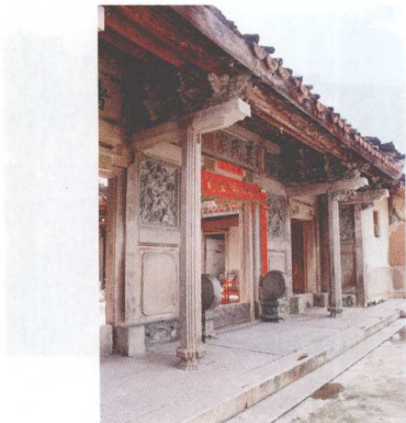
达濠吴氏家庙——红字祠堂