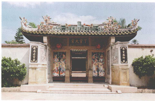
潮安磷溪丁宦大宗祠

四朝元老家；潮安磷溪的“丁宦大宗祠”，庵埠的“文祠”，宝垅的“林家庙”，浮洋井里的“大夫第”，仙庭的“待御宗祠”，龙湖的“许氏宗祠”；澄海程洋岗的“蔡氏宗