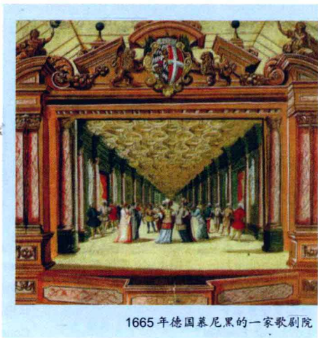
1665年德国慕尼黑的一家歌剧院

The Baroque era covers the years from 1600 to 1750 and saw the introduction of several new forms of music, mostly developed in Italy. Opera was one of these. At that time, a group of poets and musicians from Florence showed great interest in ancient Greek culture. They decided to give new life to the Greek dramas. So they not only composed music for the ancient Greek stories but also made the chorus (a group of singers) put on the stage costumes and act out the stories—and opera was formed.