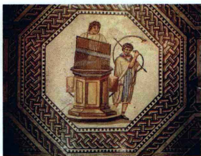
水动风琴(hydraulis)——风琴(organ)的前身

The spread of religion across the world took music even further into people's everyday life. The most important feature of music in the Middle Ages was that it had changed from monophony to polyphony. One of the greatest styles of music at that time was Roman music, represented by Gregorian Chant, a classic of Catholic music.