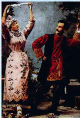
俄罗斯民族舞蹈家

As the nationalist movement took place in Europe in the 1830s, musical composers started to become aware of cultural differences between nations. This is the reason for the rise of nationalism in music. It grew rapidly in Russia, eastern and northern European countries. The composers of nationalist music usually liked to show the culture and the spirit of their nations through music.