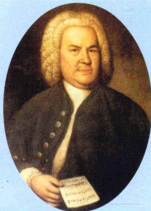
Johann Sebastian Bach (1685-1750)