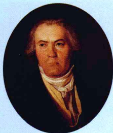
Ludwig van Beethoven (1770–1827)