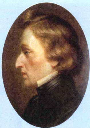
Frédéric Chopin (1810–1849)