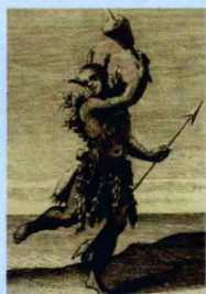
拨浪鼓(rattle)是最古老的打击乐器(percussion instrument)

Music can be traced back a very long time. Before there were instruments or even languages, people were able to express themselves through their voices. By changing the pitch of the voice, new sounds were formed and could be used to communicate. At times of hunting or worship, ancient man would gather together to celebrate. When their voices joined together, a chorus of sound was formed and the first traces of music were formed. Later, man would find simple musical instruments: pieces of hollow wood or stones that could be banged to make sounds—and music was born.