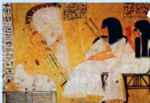
公元前12世纪的埃及竖琴(harp)

年。那时,生活在美索不达米亚的古老文明——美尔族已经拥有一套完整的乐器。考古学家发现的书面记录显示苏美尔人的皇宫里有专业歌手和大型的乐队。虽然我们无法知道当时的音乐是怎么样的,但可以肯定的是音乐在苏美尔人的生活里很重要。中古时期的音乐不断发展,埃及、中国、印度和希腊形成自己的乐器和风格,而音乐在这些国家的文化中变得更加重要。