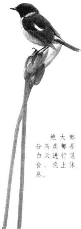
绝大部分鸟类都是白天进行觅食，晚上休息。