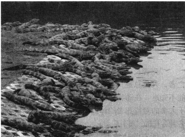
扬子鳄主要分布在我国安徽、浙江和江西等省的局部地区，为了保护这个古老而珍贵的物种，我国在安徽、浙江等地建立了扬子鳄自然保护区。

绝大部分的生物，其性别取决于性染色体的差异，主要分为XY型和ZW型两种；少数生物的性别取决于体细胞染色体的倍数性，如蜜蜂，未受精的卵发育成