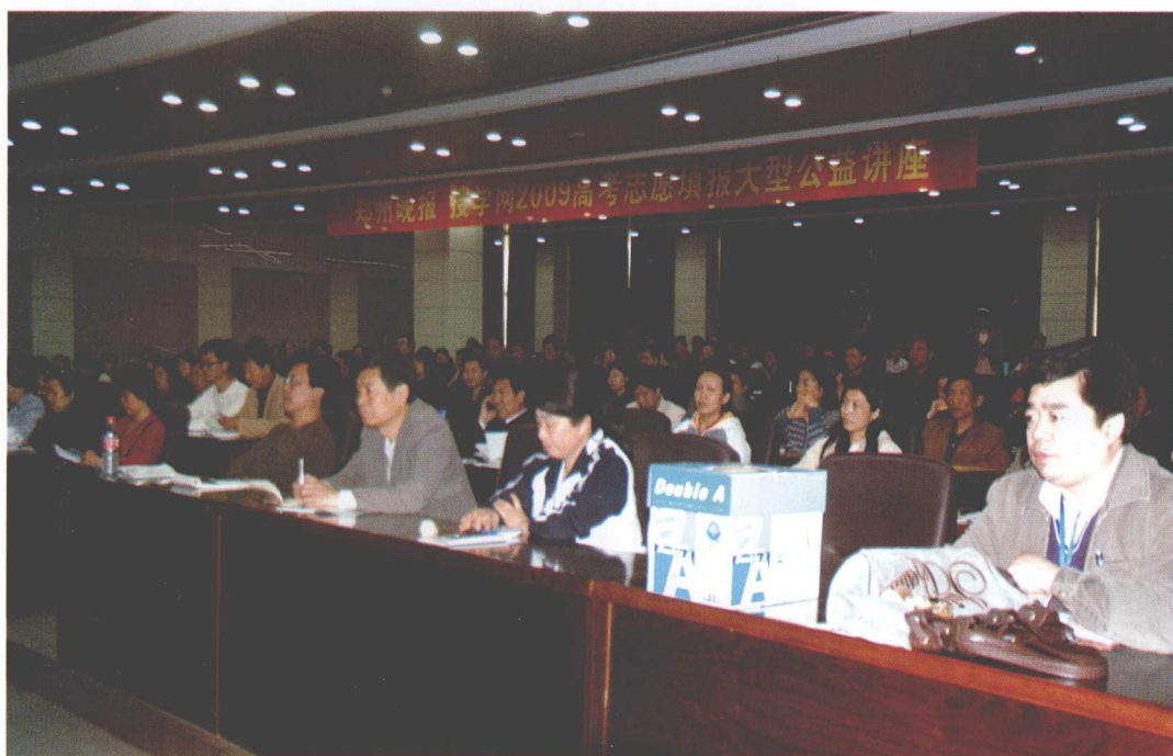
▲2009年高考填报志愿全国巡回讲座河南郑州站的现场座无虚席。