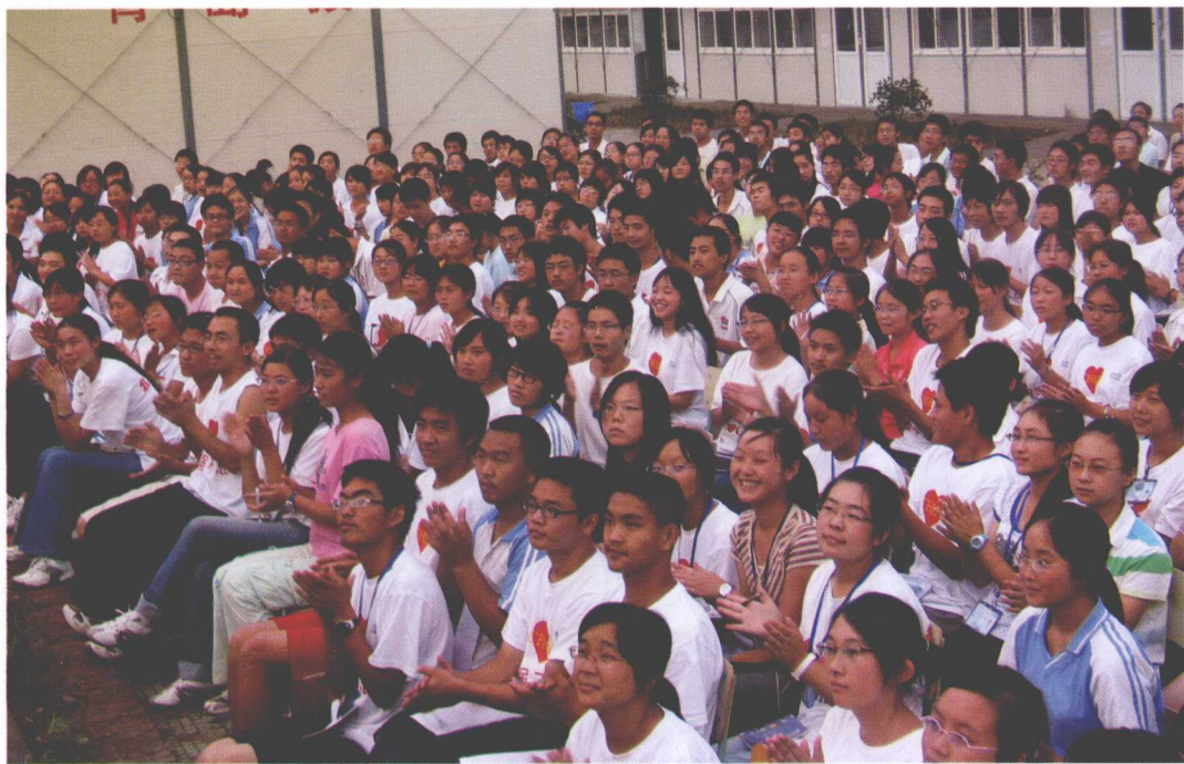
▲ 北川中学高 08 届的 593 名考生是搜学网高考填报志愿全国巡回讲座最特别的听众。