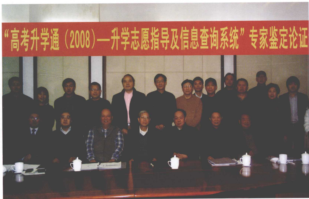
▲ 2008 年 1 月 14 日，《高考升学通》通过国内专家组权威认证。专家组成员由一直关心高考志愿填报指导的教育部领导、省招办领导和大学招办领导组成。