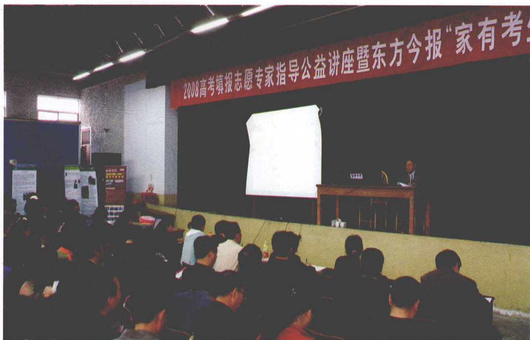
▲2008年高考填报志愿全国巡回讲座河南郑州站，数千家长冒雨前来，场面十分感人。当天特邀河南省原招办主任侯福禄为家长传授填报志愿的技巧。