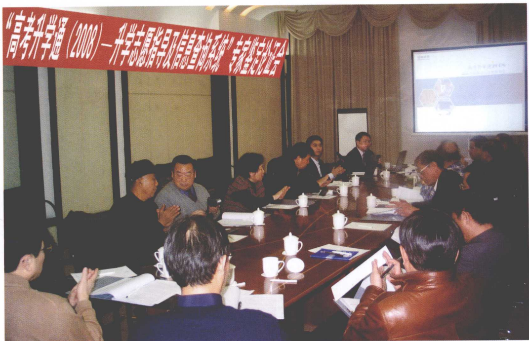
▲ 2008 年 1 月 14 日，《高考升学通》专家鉴定认证会现场，专家们在热烈地讨论。