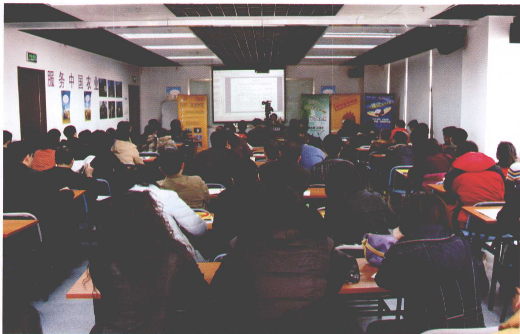
▲2009年高三家长大学堂第二期的开课现场（此课堂是针对北京地区填报志愿开辟的专门课堂，每周六开讲）。