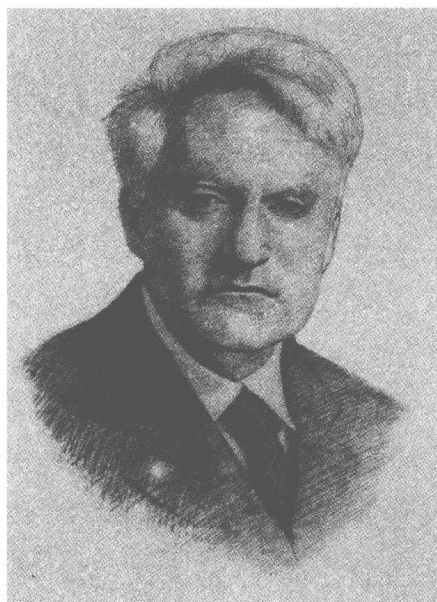
Cardozo (美) 卡多佐