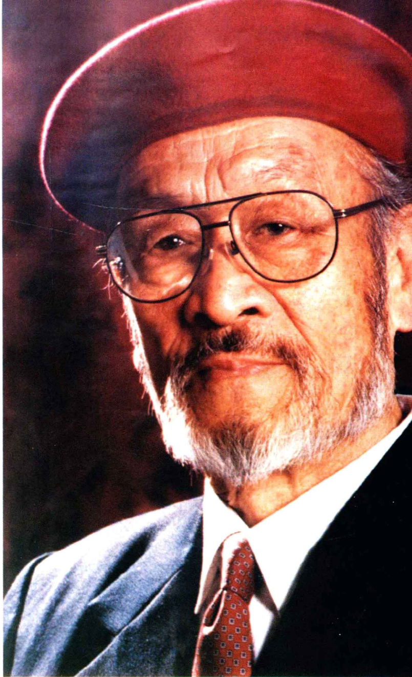
1994年12月，王洛宾作品演唱会在深圳举行，这张由深圳摄影家拍摄的王洛宾像，被制作成巨幅照片，矗立在特区繁华的大街上。