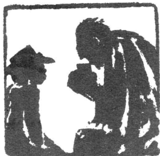
摹《老人与海》俄译本插图。 原画家(俄)波·弗拉索夫。