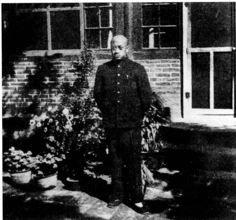
作者 1934 年接任乡村建设研究院院长。这是当年在院长办公室前的留影。