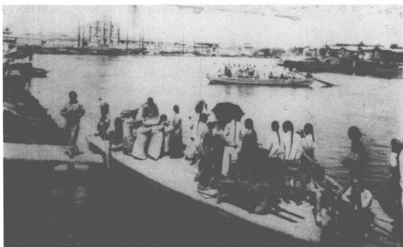
清末天津三岔河口的热闹景象

说起老天津的第二宗宝——炮台,有人误以为是始建于清嘉庆二十二年(1817年)的大沽口的炮台,其实是指早于它170多年的、建在天津城周围的炮台。明代,朝廷为加强天津防务,于崇祯十二年(1639年)在天津卫城外拨民地建炮台7座,派重兵把守,昼夜严防。当时的7座炮台位于三岔河口北、窑洼南岸、西沽、邵公庄东梁家嘴、城西双忠庙南、海光寺、马家口一带。清康熙《天津卫志》中的《天津卫图》上也标明了它们的大体位置。7座炮台各具特点,攻守兼备。