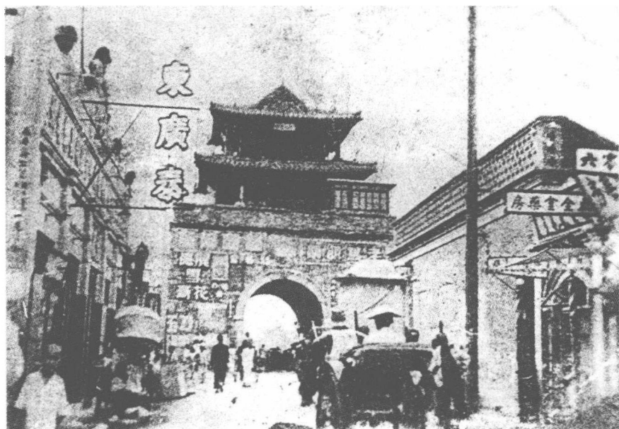
以鼓楼为中心的老城市景繁华

1921 年，饱经沧桑的鼓楼落地重建，为铭记天津城的历史，人们请书法家华世奎题写了“镇东”、“安西”、“定南”、“拱北”四座城门的名字，并制成石额镶嵌在鼓楼四门之上。