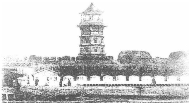
三岔口炮台在清同治十三年（1874年）改建后增加了5层瞭望塔

藏经阁始建于明万历七年（1579年），砖木结构，古朴庄重。它的地基大大高出地面，基上为2层高阁，雕梁画栋，气宇不凡。阁之飞檐四出，如同鸟翼开张。藏经阁不同于一般寺庙建筑仅在檐顶四角悬铃，它在飞檐奇突的阁顶四周、屋脊房椽端头系有千余个铜铃，不仅美化了楼阁，有风吹来时，铃响悦耳，可飘扬数里之遥。天长日久，藏经阁的正名渐渐被淡忘，人们习惯称之为铃铛阁了，正如清嘉庆年进士蒋诗所言：“津淀城西稽古寺，藏经高阁号铃铛。”