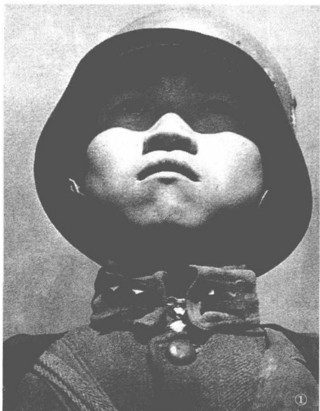
◎ 美国记者拍摄的身着德式军装的中国小战士，被用作《生活》杂志的封面。

当今世界，仍然必须拥有军队。1991年2月海湾战争，当伊拉克共和国卫队被围，萨达姆立即发出求和声明。在他眼中，失去军队，他将失去国家，乃至生