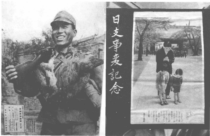
◎ 侵华日军肩扛小鸡凯旋，不久后可能成为妻儿老小祭拜的对象。

如果说1949年10月1日是“中国人民从此站起来”的开始，那么1945年8月15日抗战胜利，则是自鸦片战争以来“中华民族从此站起来”的开始。