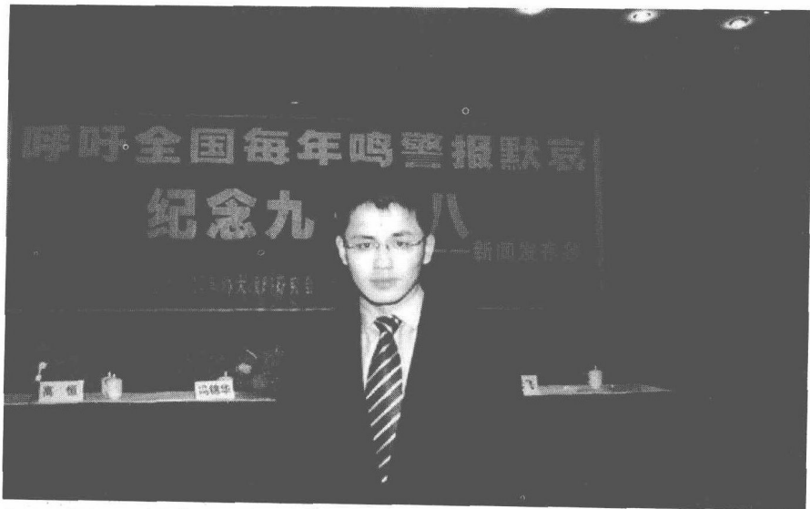
◎ 2004年3月，我与有关机构发起“倡议‘九一八’全国鸣警报”新闻发布会。

毁世界、现在也能够撼动世界的能量。不过许多中国人有时也免不了担心他们又如同太阳黑子一样，突然爆发，再次令世界天崩地裂。