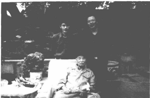
◎ 2001年6月，我与宗相辉在北京拜访孙毅中将，希望呼吁最高规格纪念抗战得到支持。