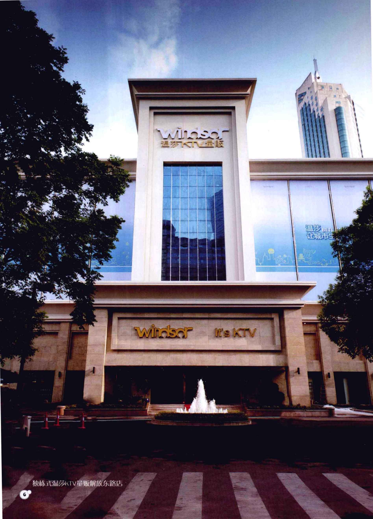
独栋式温莎KTV量贩解放东路店