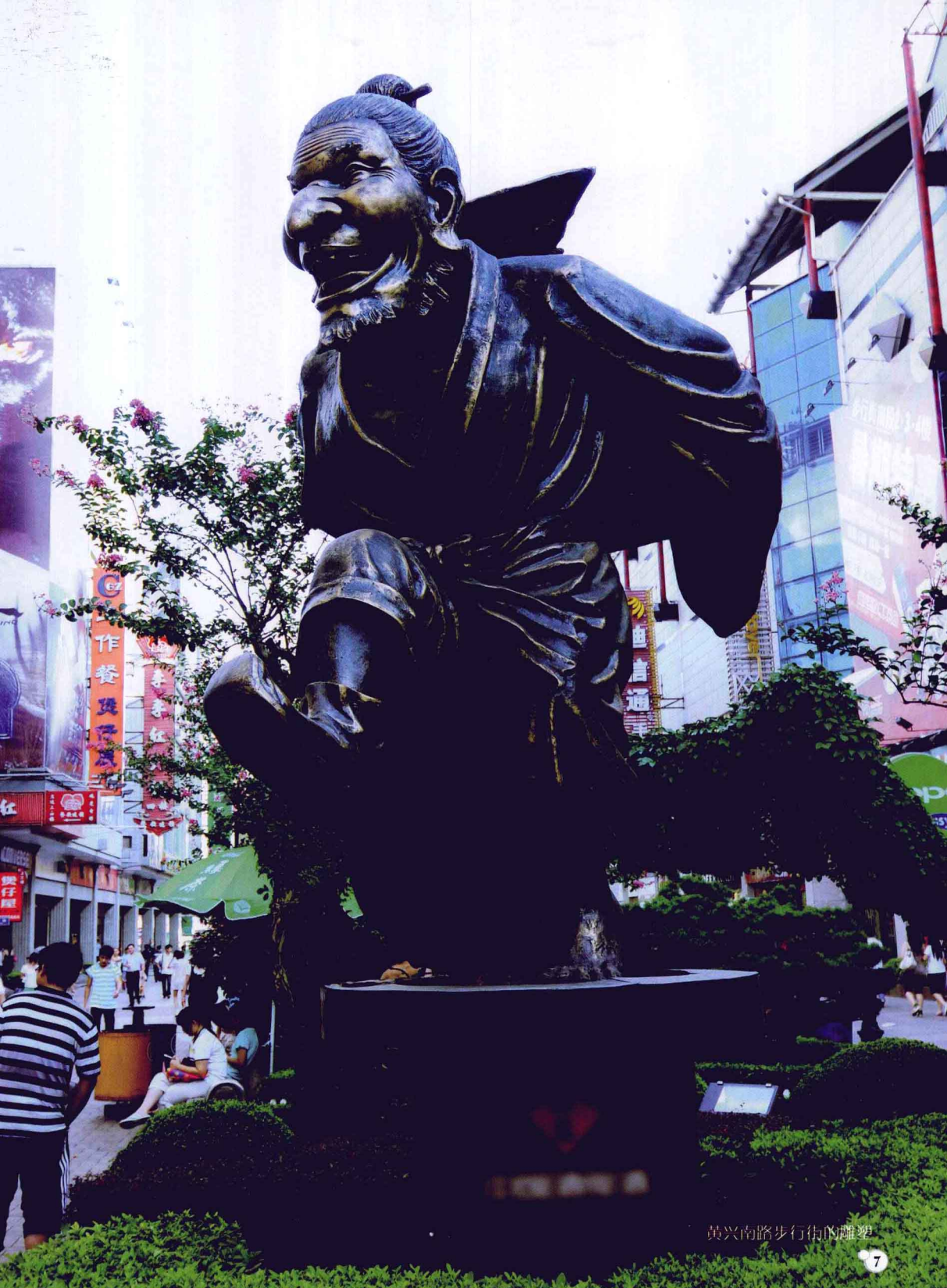
黄兴南路步行街的雕塑