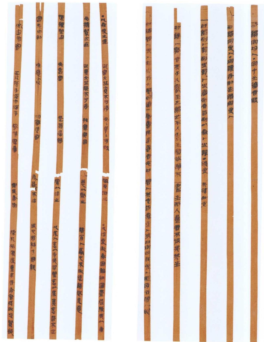
睡虎地秦簡 2 (左图)