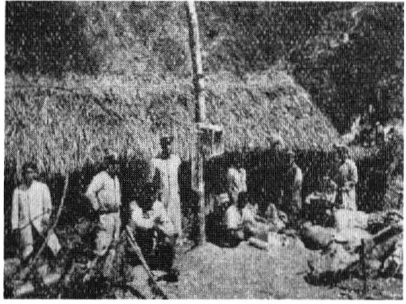
依理蕃計畫，1914年日軍征伐了太魯閣蕃。