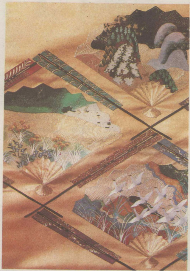
刺绣和服带(中国·江苏)