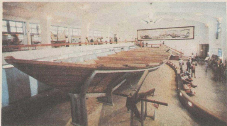
宋代中国海船(1974年出土)