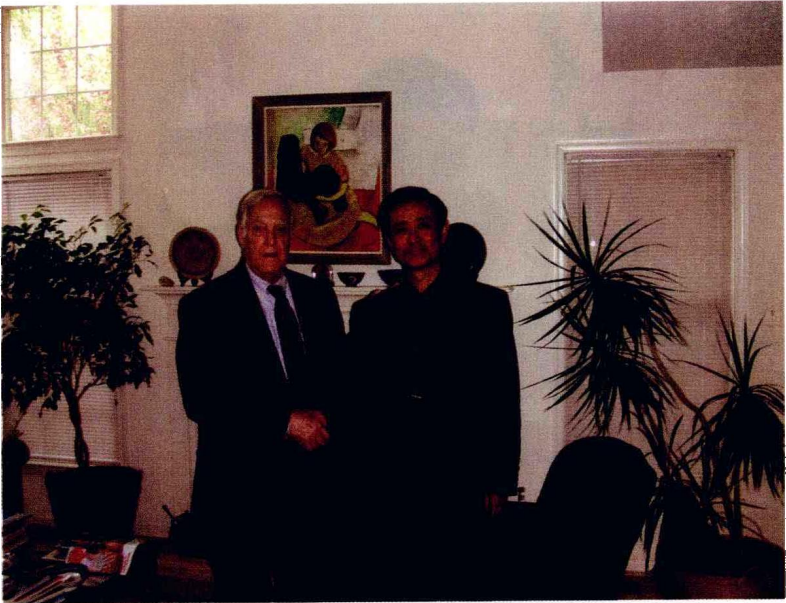
疑难病会诊，此为在美国卫生部医学顾问爱德华教授家中