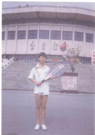
△ 留着男孩一样的短发