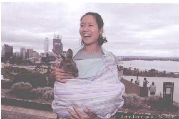
△ 在澳大利亚，怀抱袋鼠宝宝