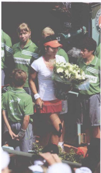
△ 法网夺冠当天和球童在一起