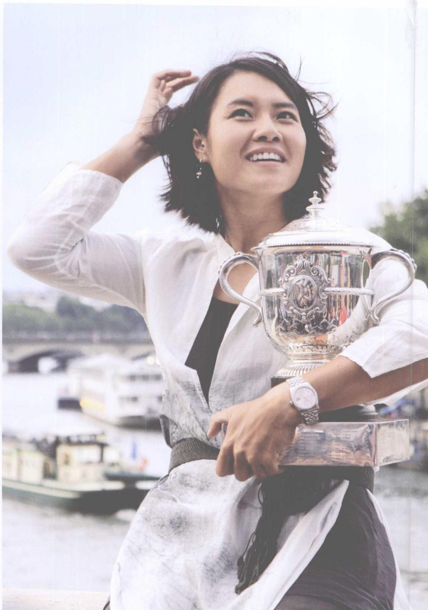
△ 法网夺冠次日在埃菲尔铁塔下