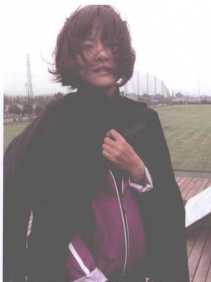
△ 风中凌乱，拍广告的间隙