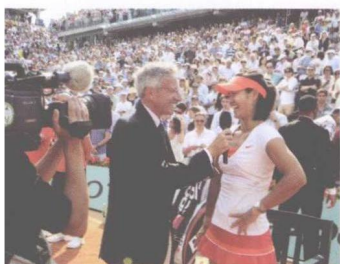
△ 法网夺冠当天，现场接收访问