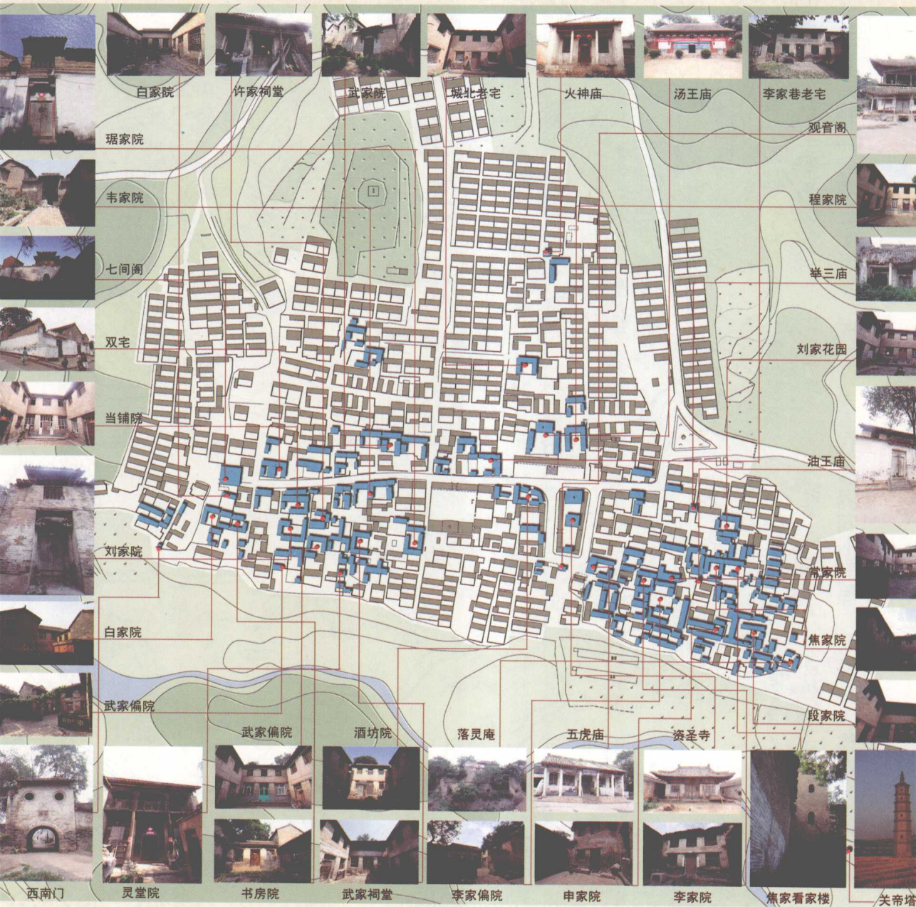
图1-2 大周村建筑遗产资源分布图