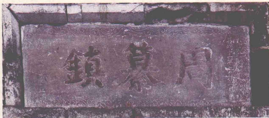
图1-7 大周村西城门上匾额上书“周纂镇”（立于明嘉靖十六年七月一日）

大周村原名“周纂镇”（图1-7），得名于后周时期。据大周村武氏家谱中《周纂纪略》记载：“后周时，曾遣大将杨纂以镇此地。地以人重，引以为名焉。”村中现在还存有与此相关的几处古迹。如村东头的杨纂练兵场、百子桥等。相传，赵匡胤上高平关取高老鹞人头时 1 ，曾经过此地，当地居民热情款待，