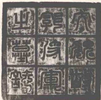
图1-5 北魏郭翻将军墓志铭盒盖拓片

秦、赵双方先后投入了数百万兵力，秦国更是举国之力量，“王自之河内，赐民爵各一级，发年十五以上悉诣长平” 3 ，秦国发奇兵断赵军后背，使得“赵卒不得食四十六日，皆内阴相杀食” 4 。赵战败后，秦将白起“挟诈而尽坑杀之，遣其小者二百四十人归赵。前后斩首虏四十五万人。赵人大震” 5 。这场战争如此壮烈，至今读到这部分史料时，仍会令人不寒而栗。“长平之战”基本奠定了秦国一统天下的格局，也给当地人民留下了难以磨灭的记忆。高平地区到现在还能随意掘得大量的白