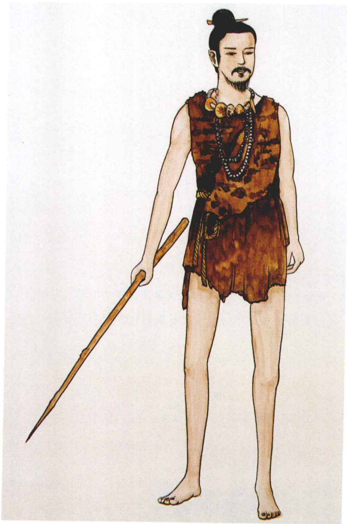
图 1-1 兽皮制作的服装（手绘）

旧石器时代早期中国有云南元谋人、陕西蓝田人、北京人。元谋人距今约七十万年，蓝田人距今约六十万年，北京人距今约五十万年。旧石器时代中期中国有山西丁村人，距今约十万年。旧石器时代晚期，有北京山顶洞人，距今约三万年。在山顶洞人的遗址挖掘出的骨针，从侧面说明了两三万年前的人类已经用骨针缝制兽皮服装。另外，兽皮是很硬的，没有加工过的兽皮是难以穿着的，所以，可以推测当时的人们已经掌握初步鞣皮工艺。鞣皮是将兽皮柔软化的技术，如用牙咬或者用石头捶打等手段使得兽皮软化。