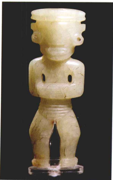
图 1-5 石家河文化遗址出土的玉人(上海博物馆藏)

石家河文化(约前二千五百年—前二千年)遗址出土的一个玉人,应是由于巫术的道具,这是一个神的形象。但很明显,这是按照人的形象描绘的神,没有细致描绘服饰,但却可以推测出当时的服装应该还是比较合体的。腰间有布缠裹,头顶扁形的冠饰。红山文化遗址还出土了一个陶人残像,仅剩的一只脚上有长筒靴。从各种出土资料看,新石器时代的衣服、靴子、挂饰、臂饰等品种比较丰富。