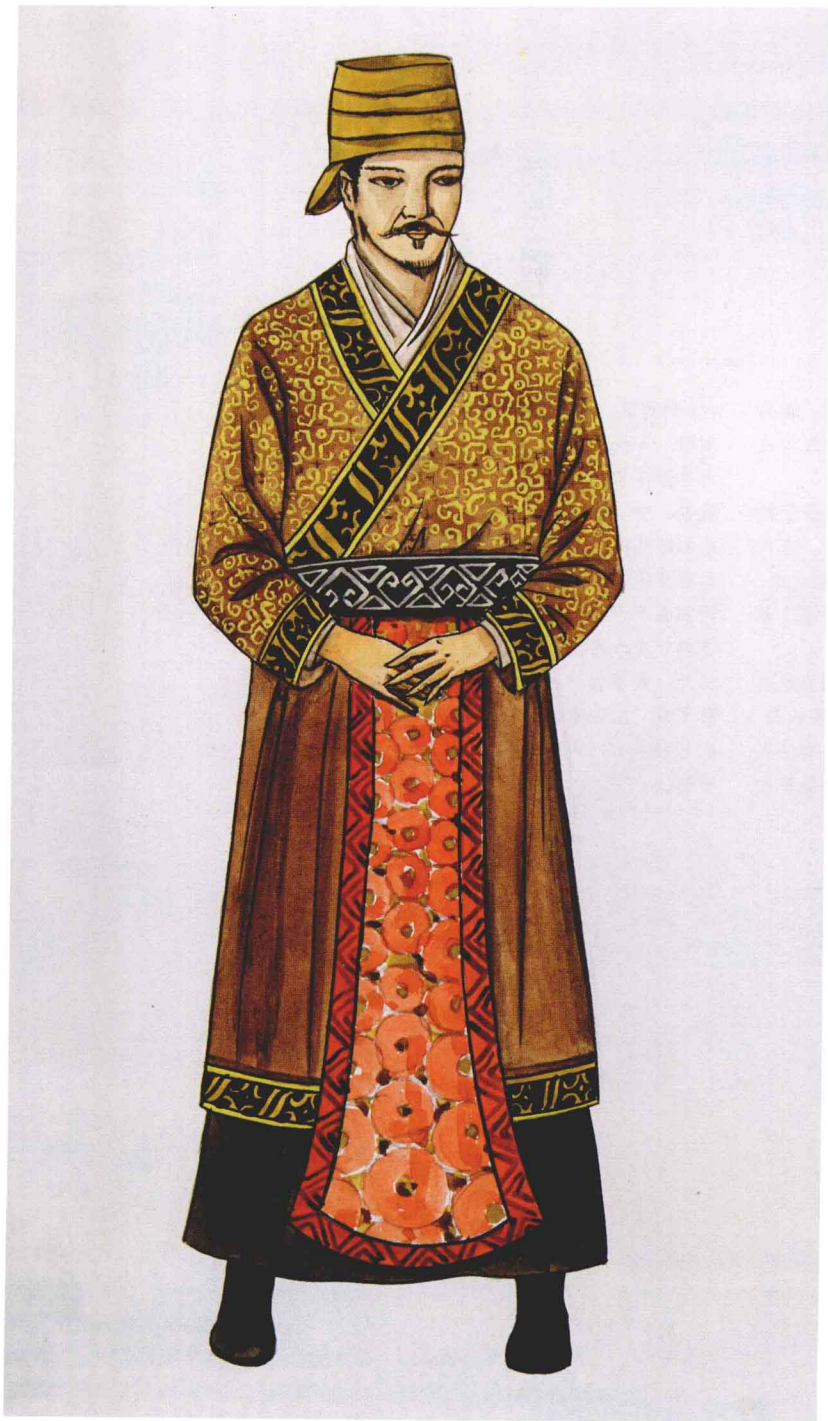
图 1-8 商代贵族服饰（手绘）

商代的服饰等级还反映在面料上，贵族服饰在面料和配饰上都与一般平民有着显著区别。安阳出土发现了世界最早织花丝绸的痕迹；是留在一把戈上的织物纹理。殷墟妇好墓出土的丝织品至少有平纹绢类、平纹丝类织物、单经双纬组织缣、双经双纬绢绸、斜纹组织的由经线显菱形花纹的纹绮、纱罗组织大孔罗等六种。其中的大孔罗是迄今为止我国出现的最早的机织罗。