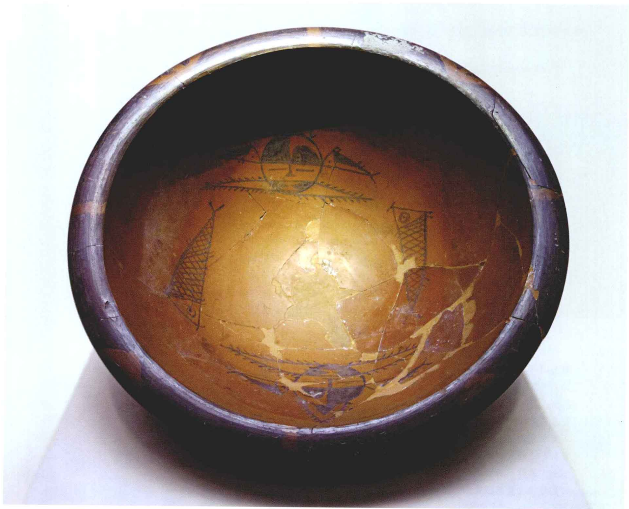
图 1-4 仰韶文化遗址出土陶碗上的人面鱼纹（中国国家博物馆藏）

新石器时代的人到底是个什么装扮，现在已经很难说清楚。如仰韶文化遗址出土的陶碗上的人面鱼纹，就给现代人大量的想象空间。是否这就是那个时代的巫师或是部落酋长的形象，已经不得而知。我们依稀还是可以辨别出他头上戴着一顶尖形帽子。