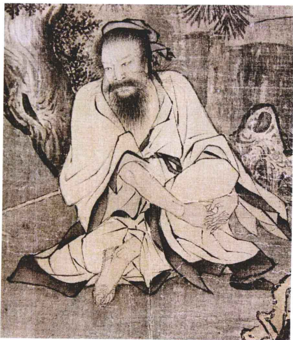
图 1-9 李唐《采薇图》(局部) 宋代李唐绘制的《采薇图》，描绘了周灭商以后，商代旧臣伯夷、叔齐逃至深山，采薇而食，宁死不食周粟的故事。画中的服饰颇有戏说的成分，更像是宋代的服装样式。周代最流行的衣服是深衣。

周代对服饰的管理已经非常细致，如周代还设有专门的“屨人”管理王和后的鞋子，王的舄分三等，依次为赤舄、白舄、黑舄。王后的舄也分三等，依次为玄舄、青舄、赤舄。从这一点就可以看出周代已经建立了相当完备的服饰等级制度和管理制度。