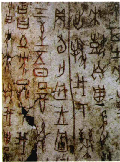
大型涂朱牛骨刻辞

而成，显然契刻者心中存在毛笔手书的参照，并在刻写中还把达到手写效果作为其追求目标。殷商末期中国古代社会已经进入文明时代数百年之久，汉字也基本发展成熟。