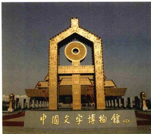
安阳中国文字博物馆