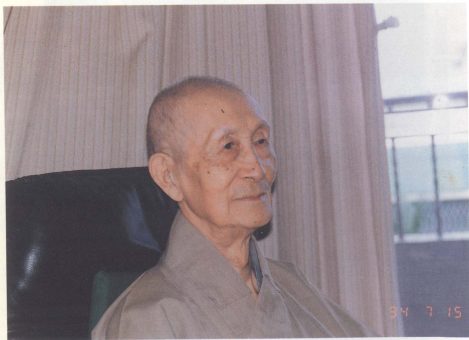
民國八十四年近影