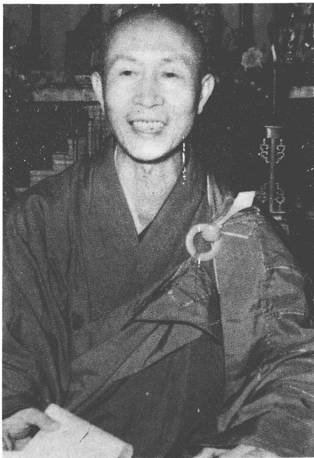
民國四十五年平光寺授三皈