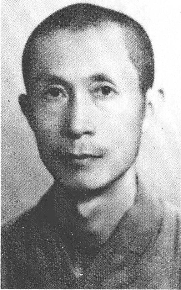
民國四十一年攝於香港