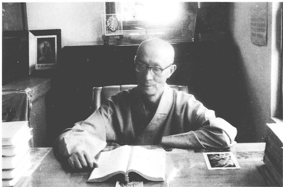
攝於嘉義妙雲蘭若關房