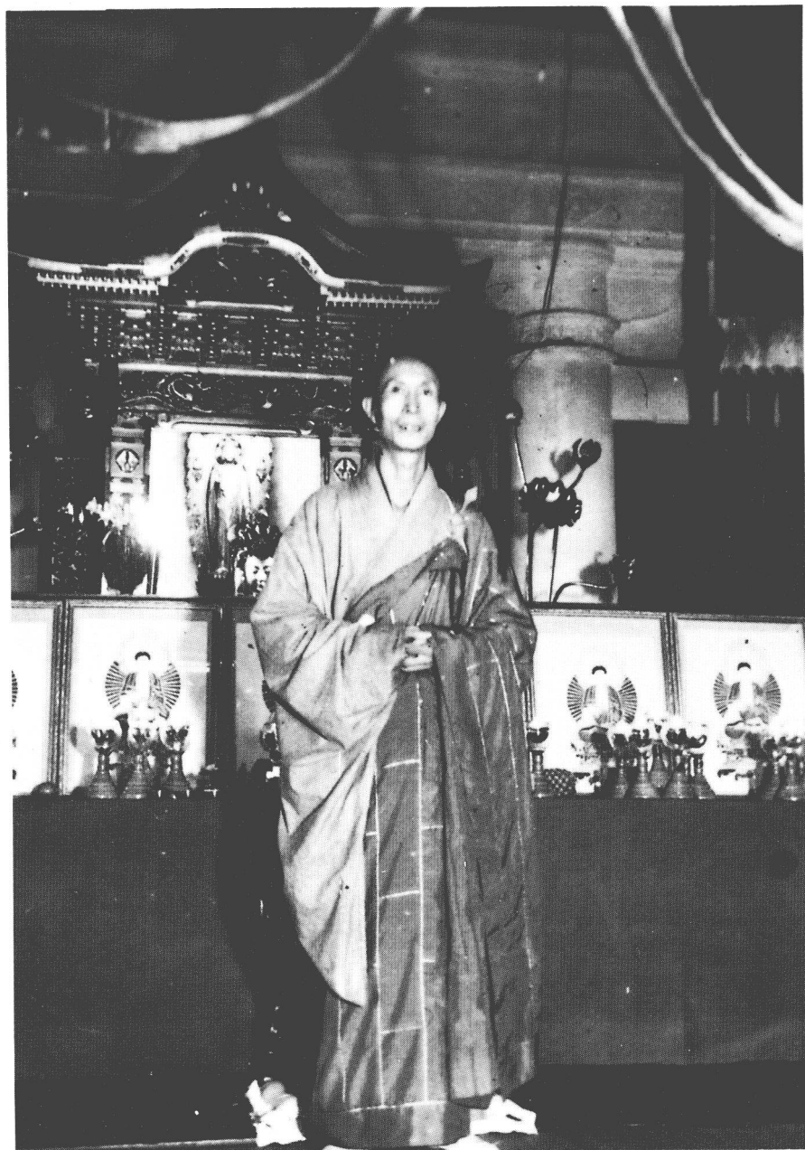
民國四十三年十月善導寺藥師法會，法會圓滿攝影