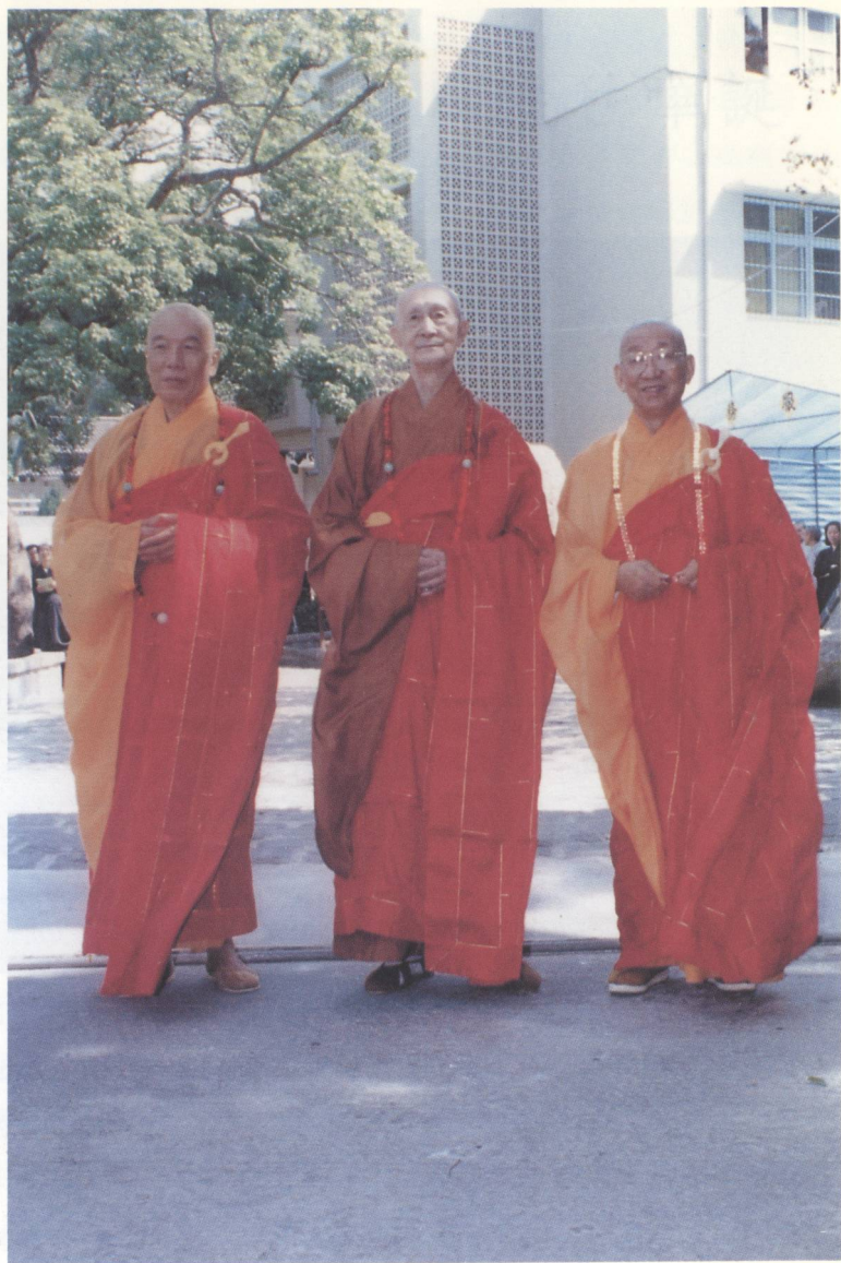
福嚴精舍落成傳戒（在家戒）