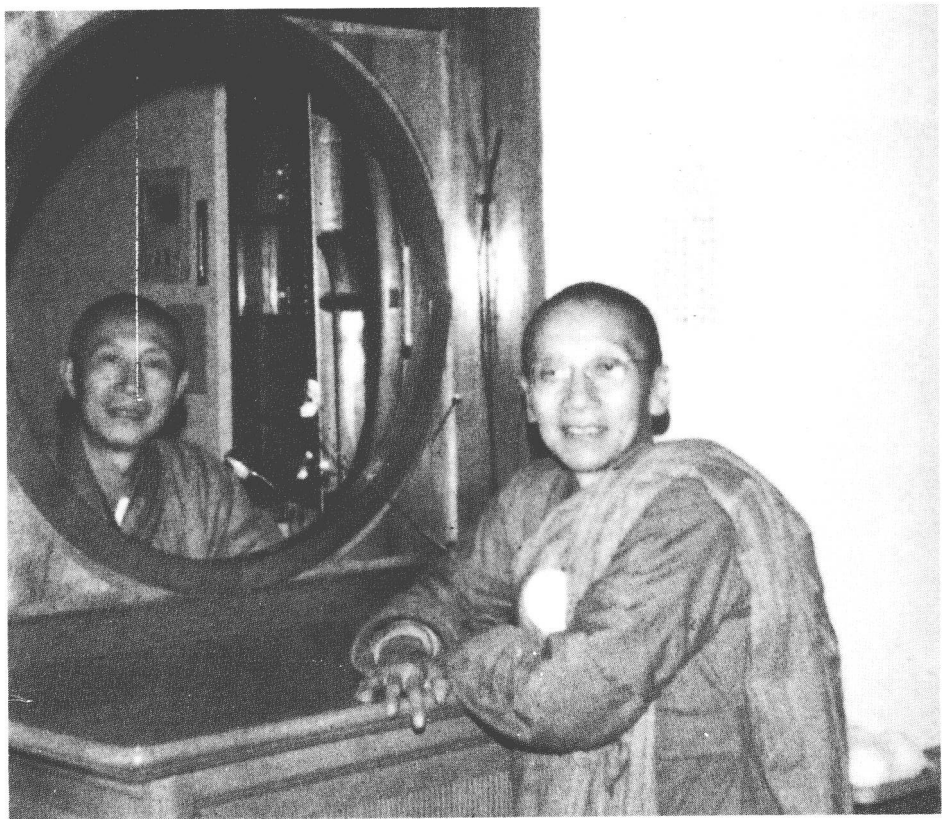
民國五十四年元月二十二日香港優曇法師來訪