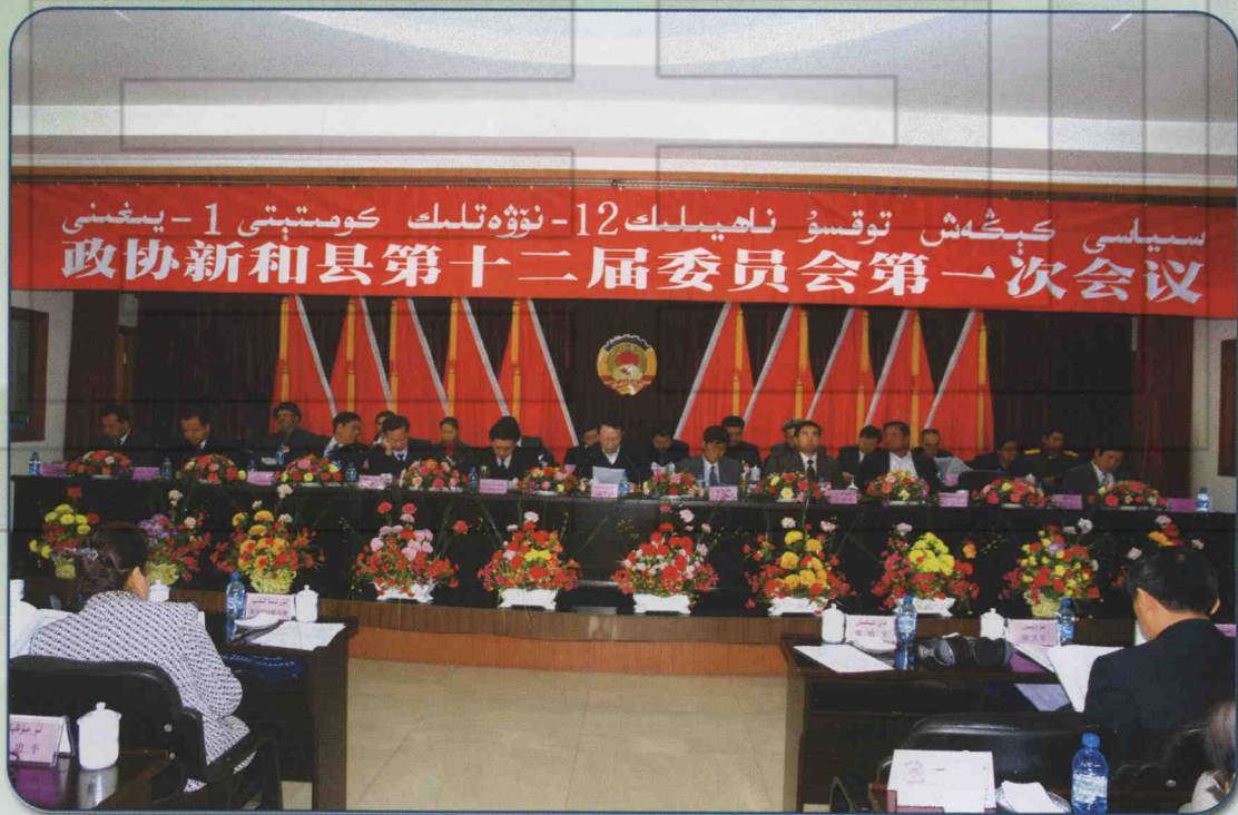
2007年11月17日，政协新和县第十二届委员会第一次会议召开。