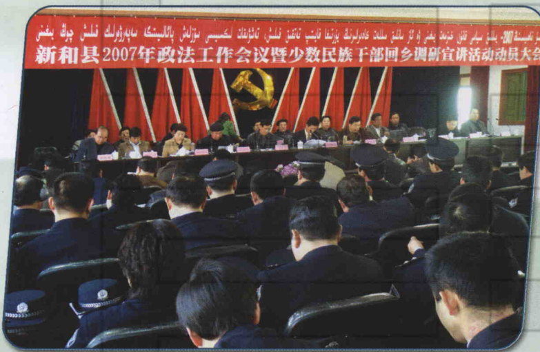
2007年2月15日，新和县召开政法工作会议暨少数民族干部回乡调研宣讲活动动员大会。