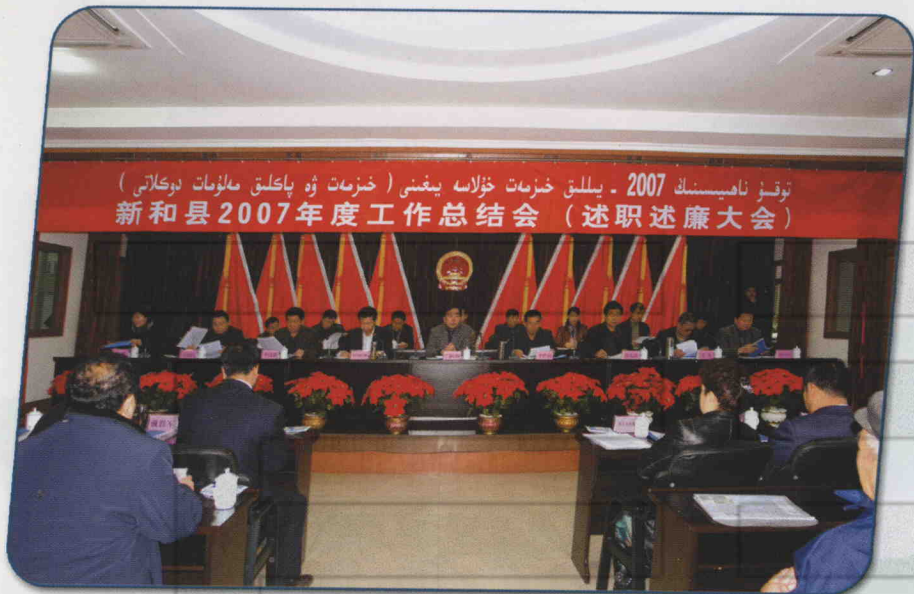
2007年12月16日，新和县召开2007年度工作总结大会（述职述廉大会）。阿克苏地委副书记、纪检书记、政法委书记闫国灿（中）出席大会并讲话。 苏斌 摄