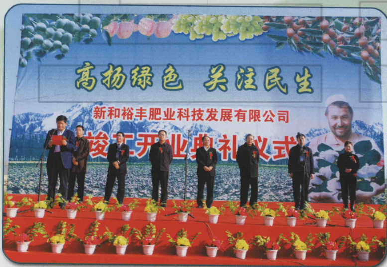
2007年12月1日，新和裕丰肥业科技发展有限公司竣工开业典礼仪式。