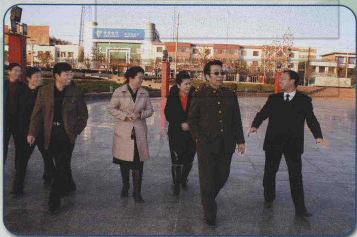
2007年11月20日，总政歌舞团国家一级演员、文职将军、全国政协委员、中国音乐家协会会员克里木在新和县班超广场以演唱会说唱方式向全县各族人民群众宣讲党的十七大精神。其间先后到班超广场、龟兹博物馆、加依村等地参观。