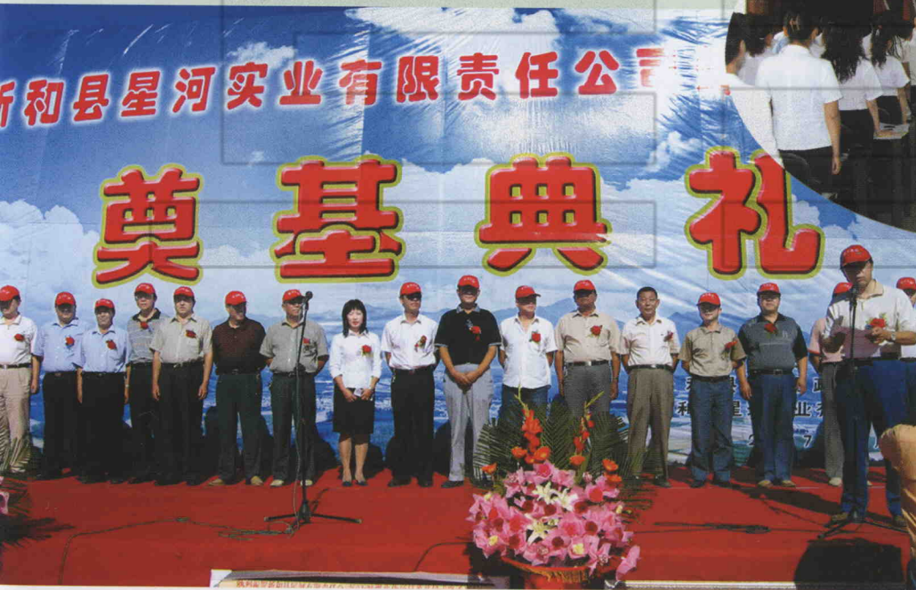
新和县星河实业有限责任公司煤焦化项目举行奠基典礼。县四套班子领导出席典礼。