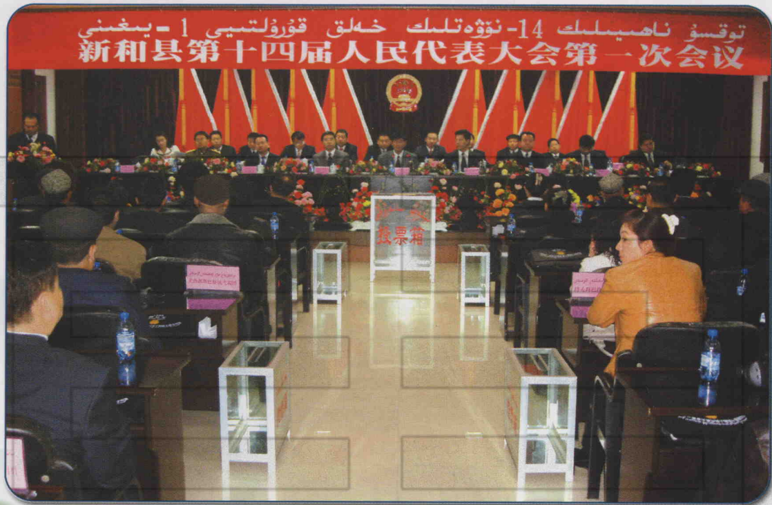
2007年11月18日，新和县第十四届人民代表大会第一次会议召开。