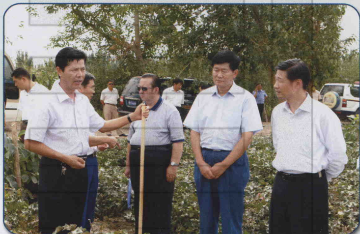
⇒ 2007年9月1日，自治区党委常委、政法委书记朱海仑（右一）在县委书记刘宝升（右二），县委副书记、县长艾合买提·买买提（左一）陪同下，在排先拜巴扎乡观摩果棉套种生产情况。