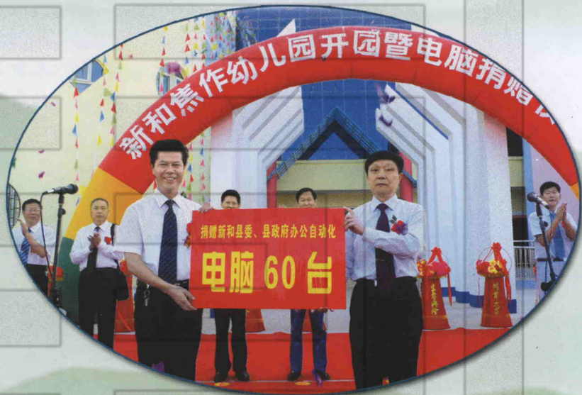
⇒ 2007年9月15日，新和焦作幼儿园开园暨电脑捐赠仪式。河南省焦作大学党委书记、市委组织部副部长郭维杰（右），新和县委副书记、县长艾合买提·买买出席仪式。