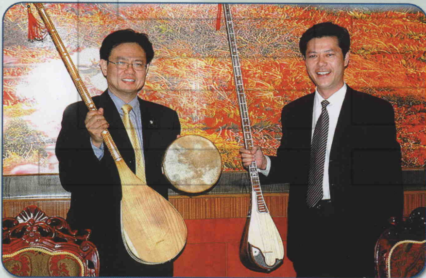
2007年4月3日，县委副书记、县长艾合买提·买买提（右一）与台湾文化旅游观光交流团团长台湾静宜大学校长俞明德互赠礼品并观看新和县民间歌舞艺术团演出。