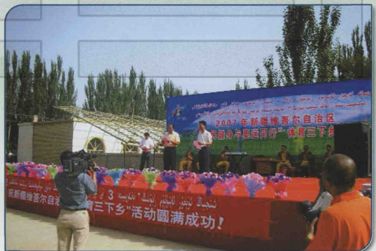
2007年新疆维吾尔自治区全民健身与奥运同行“体育三下乡”活动在排先拜巴扎乡拉开帷幕。