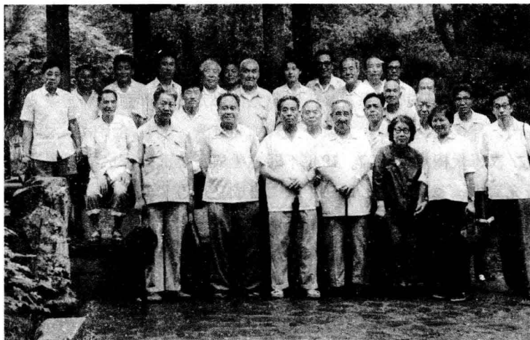
1982年7月於上海武術表演會上與傳鐘文、孫劍雲、顧留馨、洪均生、楊振鐸、馬岳梁等太極名家合影