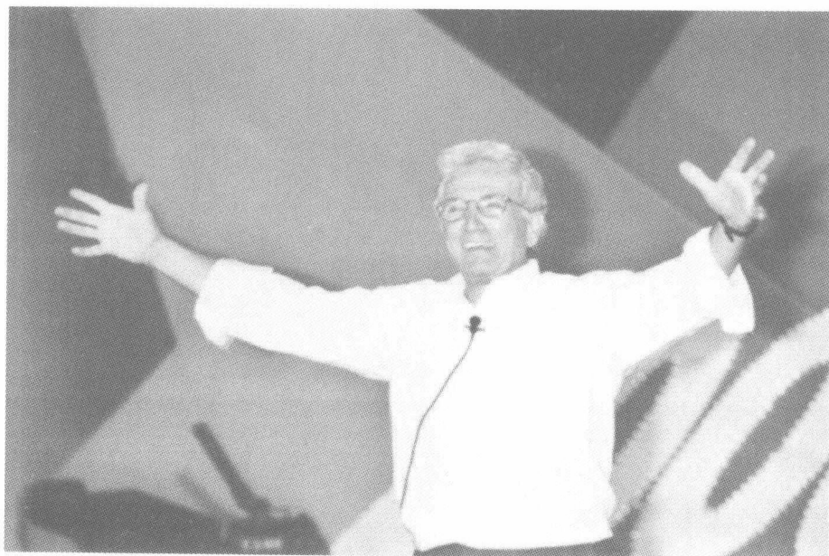
乔·吉拉德演讲激情四射