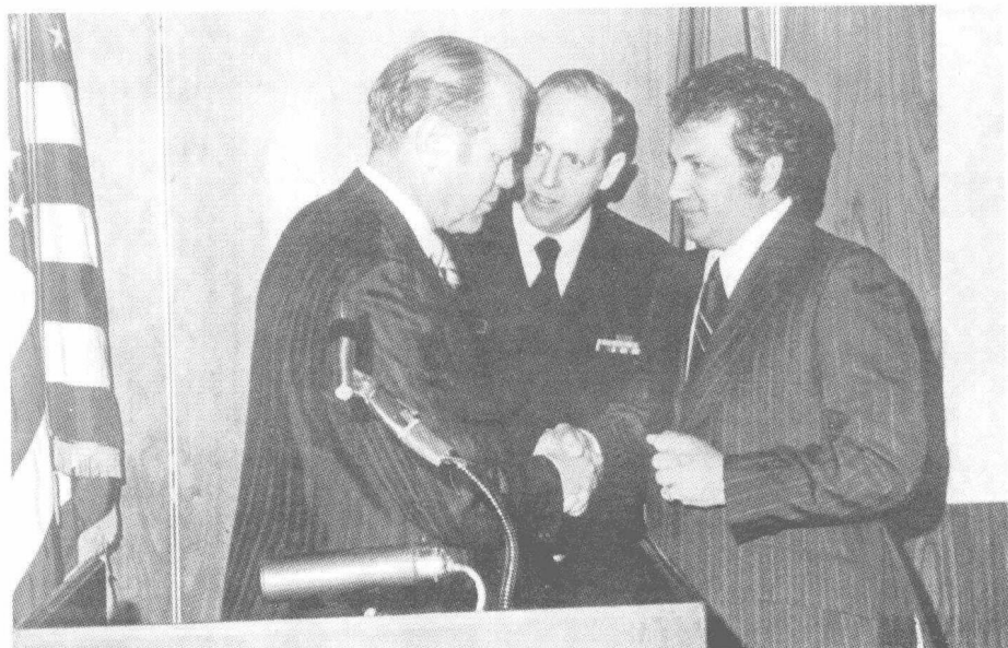
乔·吉拉德(右)受到美国第38届总统杰拉尔德·R·福特(左)的接见