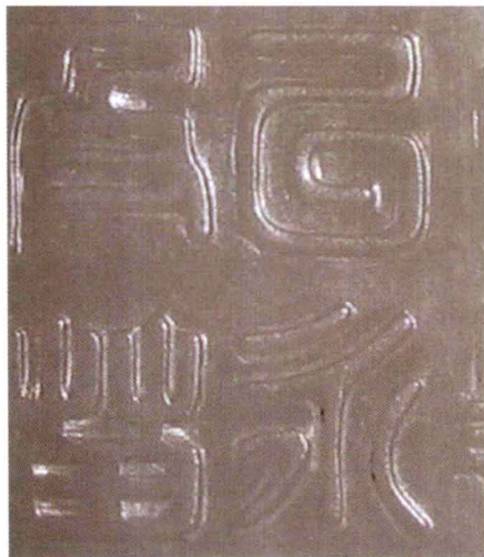
○ 白玉御赐功臣封爵铭牌印文