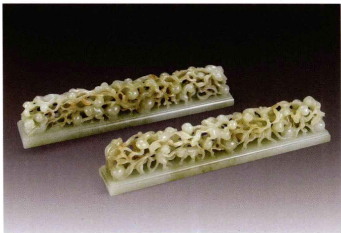
○ 清中期 白玉透雕猴攀桃镇尺

现在有些治玉高手仿清中期玉器可达七八成，这种水平的玉件我们称之为“仿乾隆工”，同样是很值得收藏和把玩的藏品。