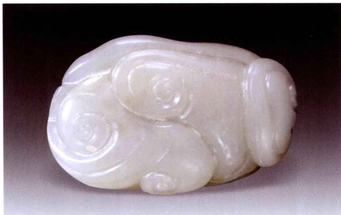
○ 清中期 籽料白玉佩

玉器不像瓷器那样普遍带有年款，我们对绝大多数古代玉器的断代都要凭借着被鉴定器本身所传递出的玉质、纹饰、刀法、工艺等信息进行，即使毕生从事玉器鉴定的人也有可能出现纰漏。对于更多的非专业收藏者来说，很容易将清代玉质、雕工、造型均好的玉器认为是“清中期”、“清乾隆”或“乾隆工”，而将制作粗劣的作品划归到清晚期或民国。其实，即使是乾隆后期的玉器，也有精粗、优劣之分，而清代晚期譬如道、咸时期，乃至民国时期，同样有很精美的“乾隆工”传世，其中存在着比较细微的区别，需要收藏者仔细审定。完成清代中、晚期玉器的断代，是一项长期而复杂，同时又具有无穷乐趣的工作，能够在这个阶段有所心得的人，就可以独立于玉器收藏之林了。