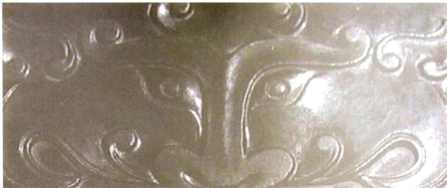
○ 白玉御赐功臣封爵铭牌（细部）

这块玉牌长方形，材料是新疆和阗一级白玉，莹白滋润，正面雕有双龙戏珠的剔地阳雕纹，两条香草龙在一颗火焰珠左右面对面昂首对峙。龙身修长柔韧，尾巴分叉翻卷。火焰珠下面是五个小篆“功臣封爵铭”，字迹工整有金石力度，体现出宫廷赏赐器的霸气，让人一目了然。牌子四周起线有边框。背面门头上的纹饰是夔夔纹，尾巴高挑，橄榄形的眼珠炯炯有神，俯视着下方的文字，鼻子很大，双翼向左张，伸展形成蝙蝠形，体现出皇家不可一世的威严。兽面纹下起线边框内四行四排十六个字“使河如带，泰山若厘；国以永盛，爰及苗裔”。从字面上分析，这块玉牌是乾隆皇帝赏赐给封疆大臣的赐品，其宫廷制作的出身不容置疑。