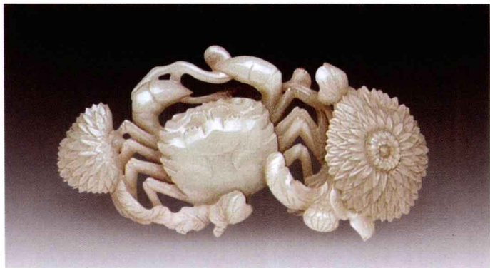
○ 清中期 青玉雕菊蟹摆件

如果说清代玉器所形成的是中国玉器制造史上的最后一座巅峰，那么，这个时代的最高海拔应该出现在杨先生文中所归纳的乾隆二十五年（1760年）至嘉庆四年（1799年）之间。在这段时间里，玉器的设计、制作已经完成了康、雍以及乾隆早期由粗放向细腻过渡的蜕变，形成了与之前各历史时期有所不同的设计特征与工艺特征，这就是“清中期”概念中的玉器作品。在实际收藏过程中，玉器断代中的“清中期”，是指清代乾隆二十五年（1760年）至嘉庆早期这一历史时段，其中不包括乾隆早期的25年，与清史学中的“中期”划分有所不同。