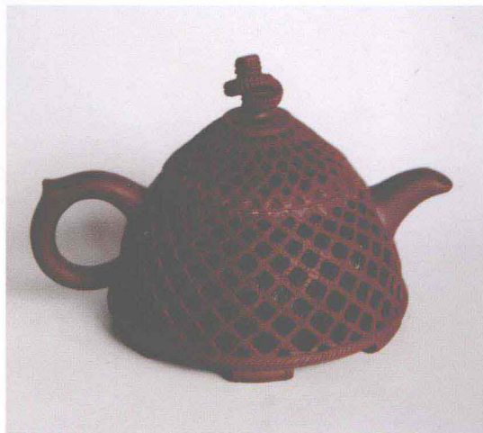
鱼篓壶 (毛阿明制作)