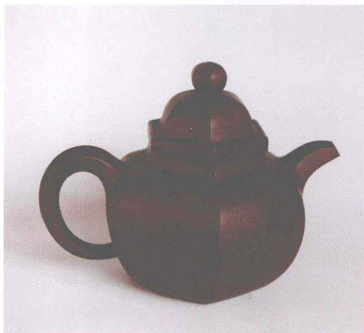
六方掇球壶 (张铭松制作)