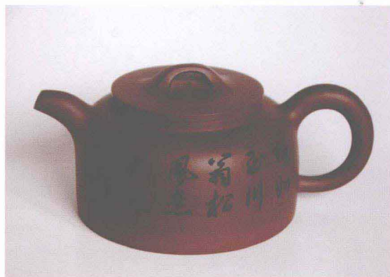
平盖得钟壶 (毛晓艳制作)