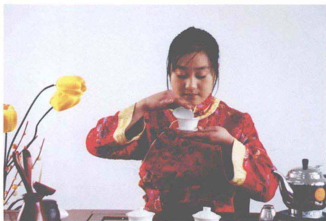
怡情花茶行茶茶艺