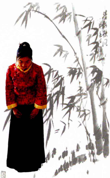
茶艺礼仪（鞠躬行礼）