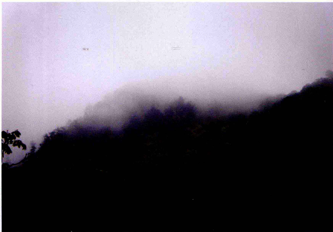
云雾缭绕的高山茶区（武夷山桐木村）