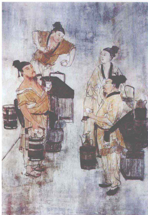
斗茶图 [元]赵孟頫 (彩页)