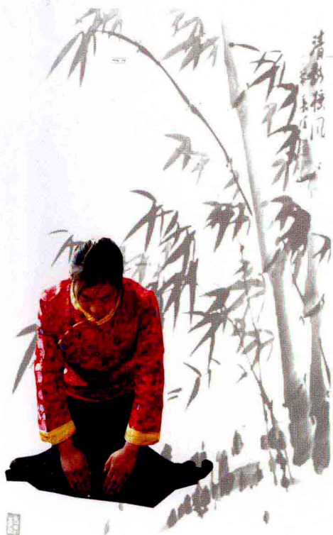
茶艺礼仪（跪式行礼）