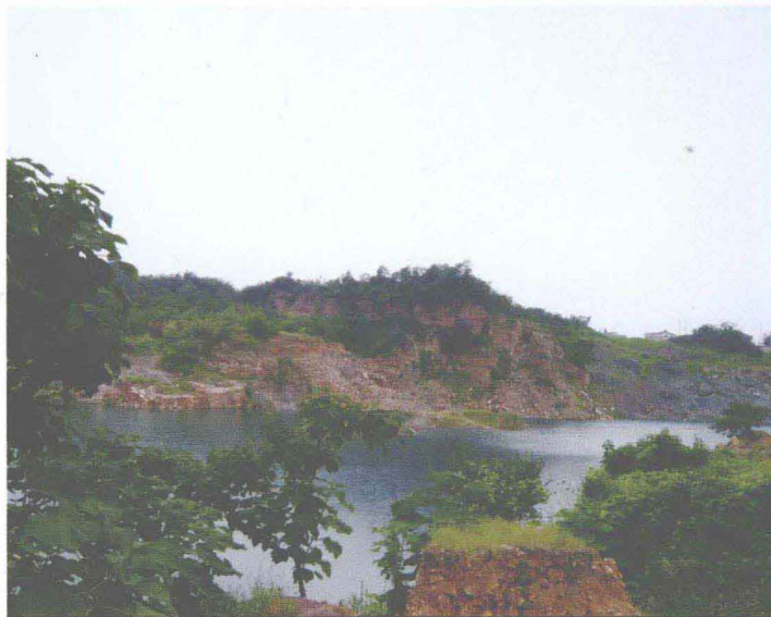
宜兴市丁蜀镇黄龙山矿