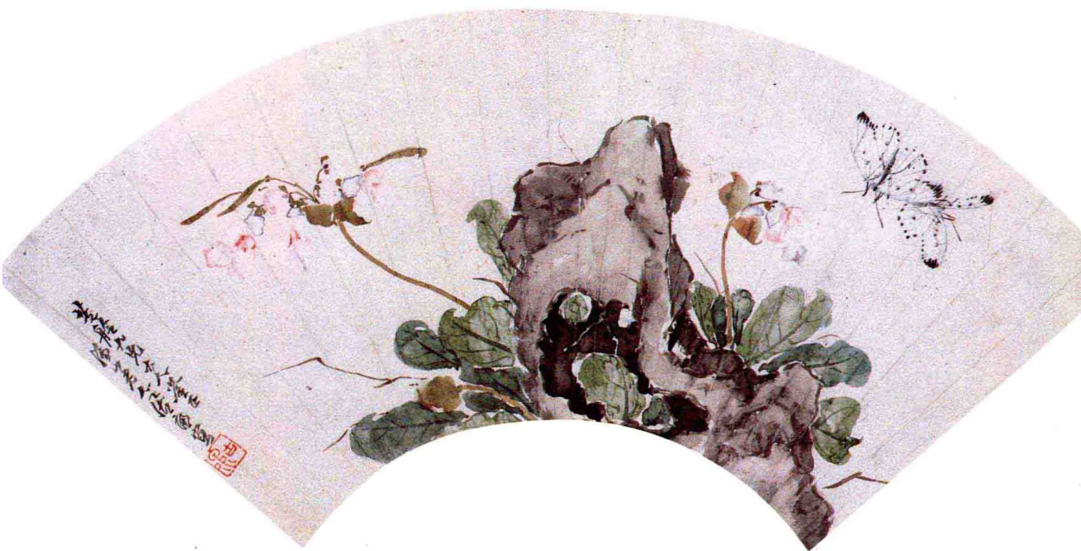
居廉草虫(上)高奇峰花鳥(下)是嶺南畫派特色之一