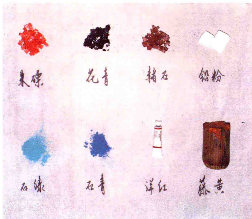
嶺南畫派愛用顏色

以羊毛毯為佳。因羊毛表面有油質不吸水，便於渲染。也可在畫紙下面墊一吸水紙，易於控制水分。