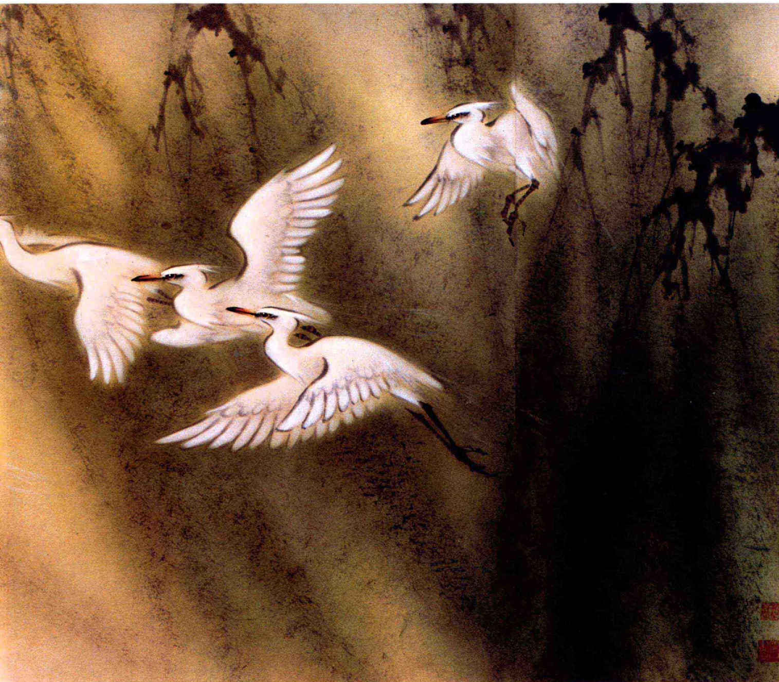
一行白鷺上青天 盧清遠作