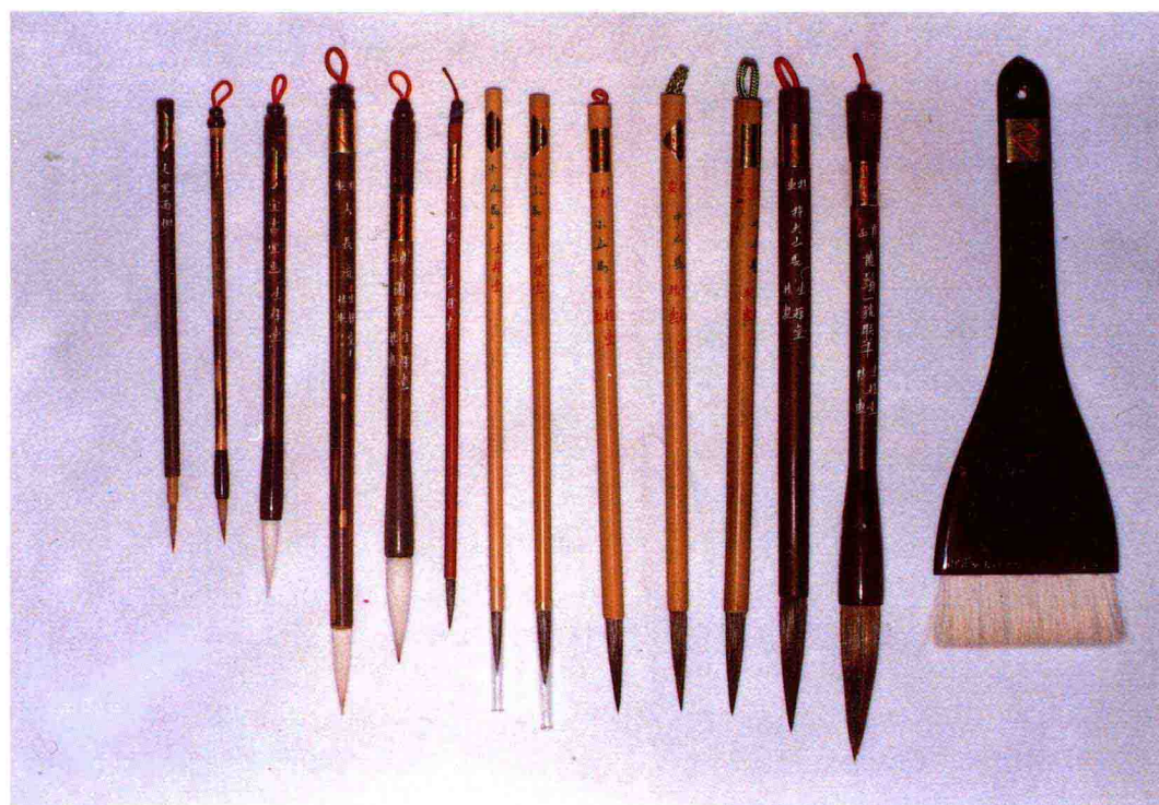
畫嶺南畫派慣用的各種筆

排筆 大聯筆 特大山馬 大山馬 中山馬 小山馬 小一山馬 小二山馬 小三山馬 蘭亭 長流 宜書宜畫 含英咀 面相