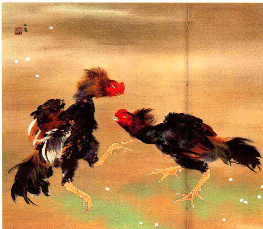
竹內栖鳳「鬥鷄」(上圖)跟橋本關雪「霜猿」(下圖)看了令人讚美又佩服。

嶺南三家歸國後的早期作品，那種雄渾淋漓，粗中有細的筆墨，和鬆濛濕潤的渲染，所受日本的影响，遠比宋孟二居為大。如果把竹內栖鳳等的作品拿到香港展出，也許更接近「嶺南派早期名家作品」的名稱，由此可見嶺南派另一條融匯中外的根，也是遠伸到日本以至世界各國去。