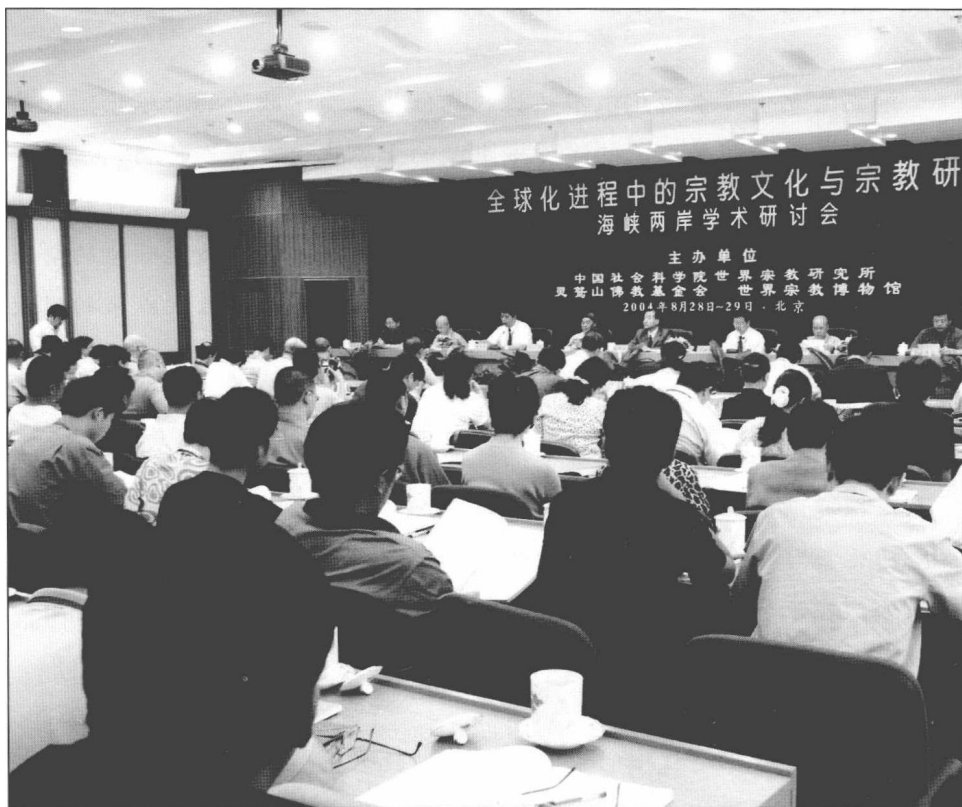
2004年8月28、29日於大陸北京召開「全球化進程中的宗教文化與宗教研究」海峽兩岸學術研討會，參與者來自兩岸三地及日本的三百多名產、官、學界人士。圖為開幕盛況。