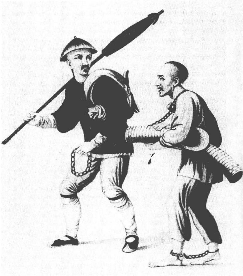
自带铺盖的犯人由衙役率领而行 [见 Thomas Allom, China, It's Scenery, Architecture, Social Habits, & c. Illustrated , 2 vols. 81 页]