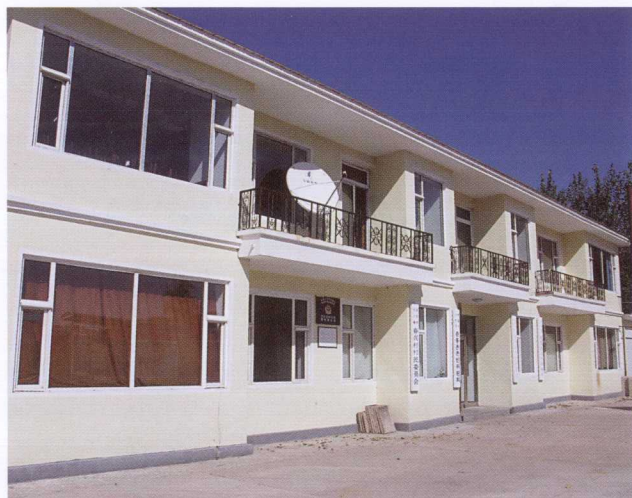
春兴村两委会办公楼 ( 2009年10月 )