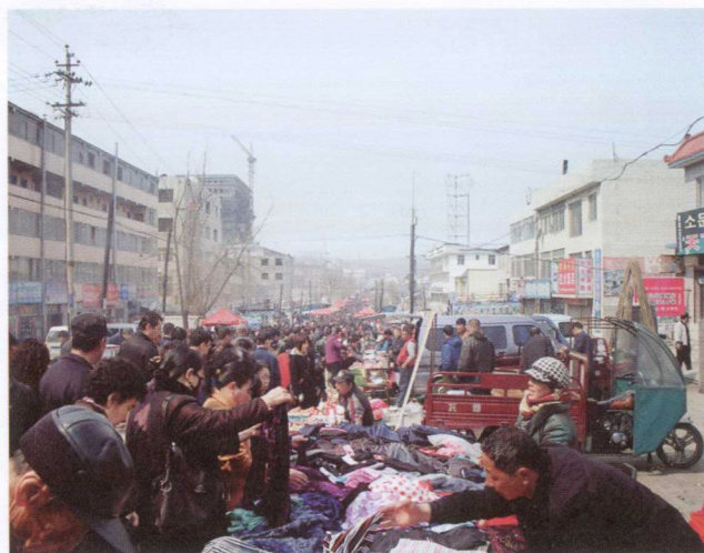
兴安大集（2009年1月）