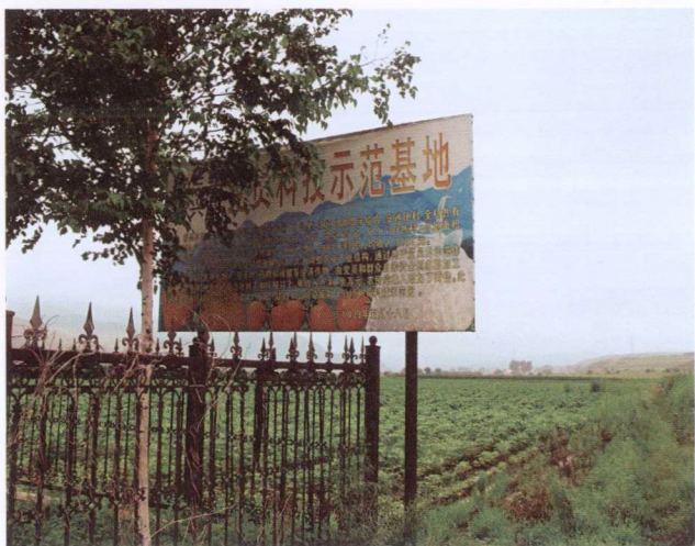
党员科技示范基地（2009年7月）