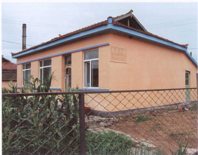
春兴村“新居工程”房子（2009年7月）