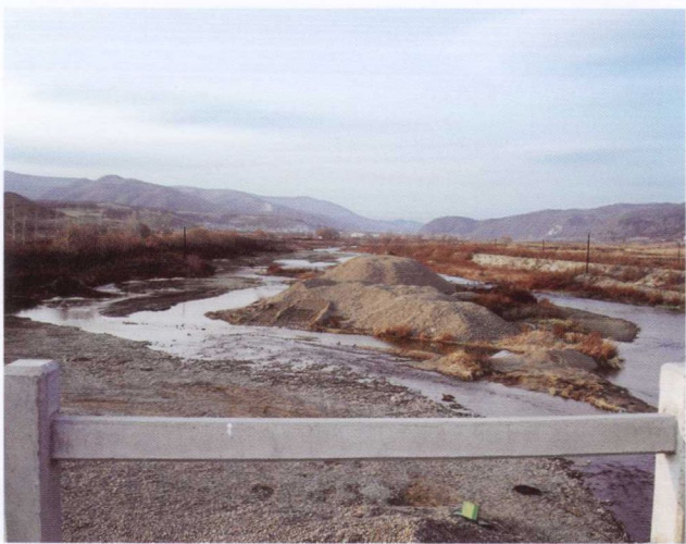
依兰河 (2007年11月)