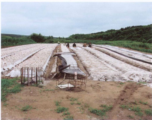
木耳生产 (2009年7月)