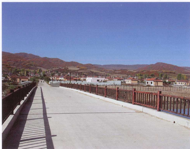
春兴村 ( 2009年10月 姜学洙 摄 )