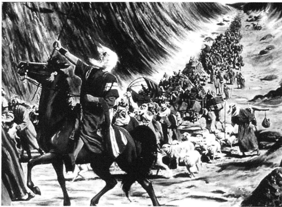
《出埃及记》中摩西劈开红海

经过了两千多年，到19世纪末叶，俄国的凯特琳沙皇开始颁布法令驱逐犹太人。接着，亚历山大二世时期又变本加厉地逼迫境内犹太人，并在1880年通过俄国秘密警察之手，集体屠杀犹太人100万之众，血流成河，成批难民不得不逃亡，涌入欧洲各国。这种迫害到亚历山大三世（1881—1884）和尼古