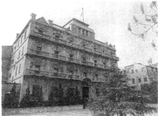
南昌起义总指挥部旧址——原江西大旅社

革命委员会任命吴玉章为秘书长，决定由周恩来、贺龙、叶挺、刘伯承等组成参谋团，作为军事指挥机关，刘伯承为参谋团参谋长，郭沫若为总政治部主任，并决定起义军仍沿用国民革命军第二方面军番号，贺龙兼代方面军总指挥，叶挺兼代方面军前敌总指挥。所属第11军（辖第24、第25、第10师），叶挺任军长、聂荣臻任党代表；第20军（辖第1、第2师），贺龙任军长、廖乾吾任党代表；第