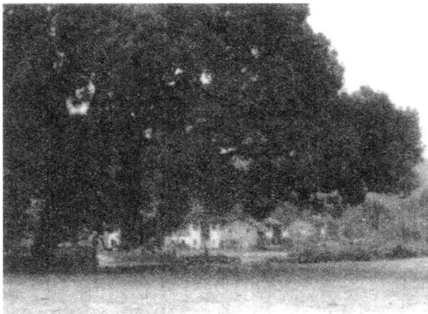
三湾改编旧址——三湾枫树坪