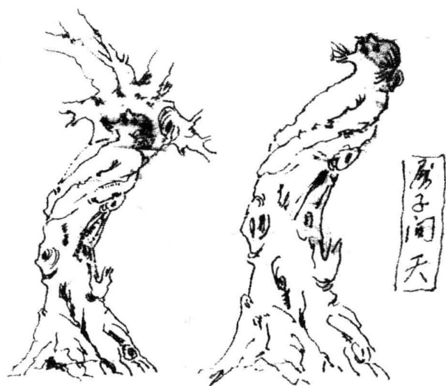
树干和树根与一个人物的诞生

艺术家如果不能以自身的较高的生命质量达到与环境的抗衡和奋争,他就成了一个庸人,只有具备旺盛的生命力和较高生命质量的人,才能达到高层的抗衡和超越,当这种抗衡的力量越强,他的艺术品力度才越强。