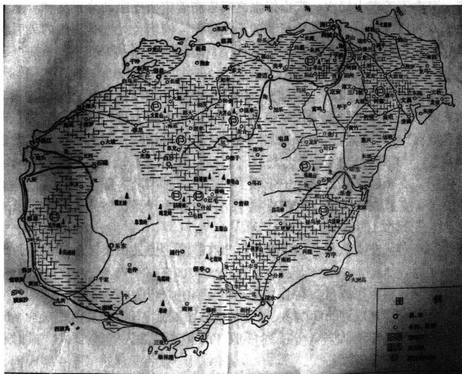
1945年琼崖抗日根据地及独立总队活动情况示意图