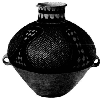
仰韶文化时期的彩陶双耳罐

尽管生产工具和生产方式还十分落后，但这时的生产力已经有了显著的提高，开始有剩余产品。在许多早期仰韶文化的墓葬中都发现有陶器、石器、玉器、骨器等陪葬品。