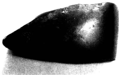
仰韶文化时期的石斧

在仰韶文化的早期阶段，文明虽然缓慢，但是却不可遏制地向前发展，其中农耕技术的发展最为显著。从发现的仰韶文化早期的农业生产工具来看，有用于开垦土地的石斧和砍砸器，有翻土松地的石铲、石耜、骨铲，可能还有木耜（因年代久远，不可能保存至今），有播种和耕地使用的