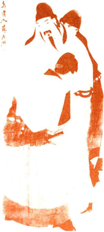
清·苏六朋《太白醉酒图》