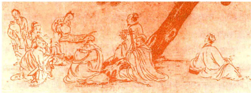
明·唐寅《临李公麟饮中八仙》