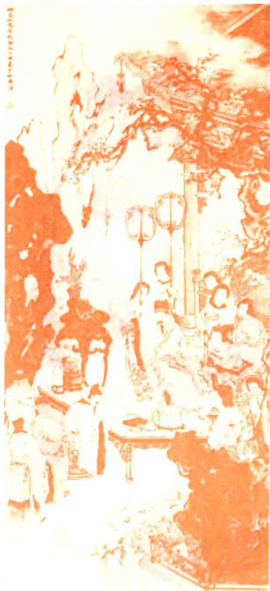
清·苏六朋《清平调图》

高力士是个宦官，工作职责是伺候唐玄宗的吃喝拉撒睡。这种工作性质决定了他要一天到晚围着唐玄宗转。因此，这也决定了高力士有一个很大的政治优势，那就是他对唐玄宗的思想活动掌握得很清