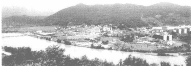
好一幅大气磅礴的学校全景图

校园绿化面积达20多万平方米，占了校园面积的70%。有乔木两千多棵，芒果树约100棵，灌木及草本植物无数。校园到处绿树成荫，花红草绿，100平方米以上的草坪有十几个。鸟叫、蝉鸣、蛙唱不断，英豪学校是一所生态校园，是绿园、果园、鸟园，又是乐园、科学园。