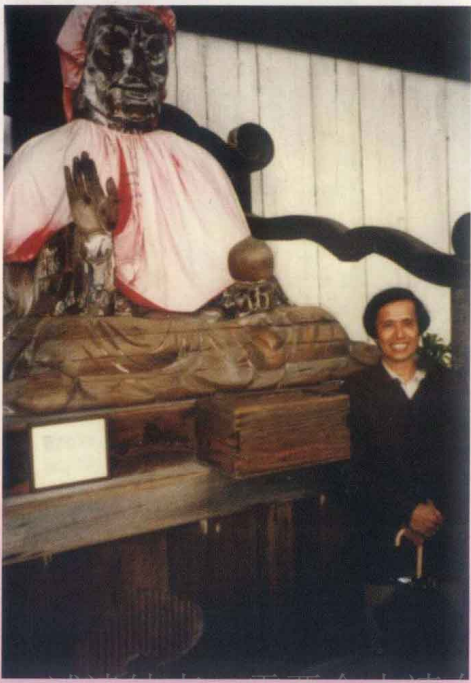
東大寺大殿左側寶頭盧尊者像與本書作者