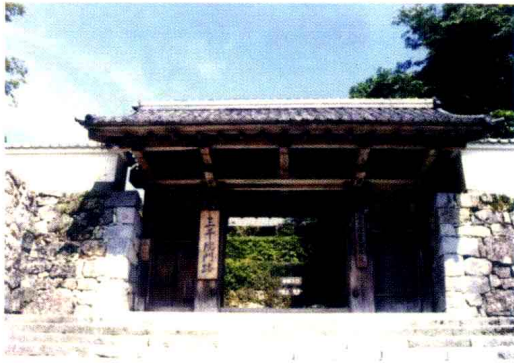
京都・大原三千院