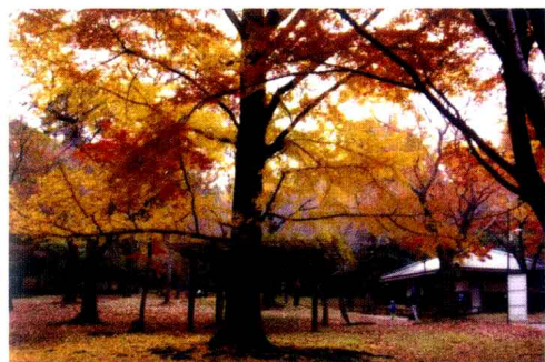
奈良・東大寺左側楓林