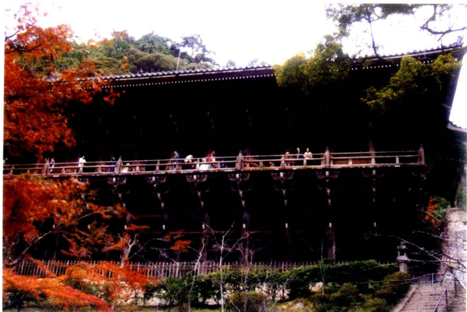
姫路・書寫山圓教寺（摩尼殿）