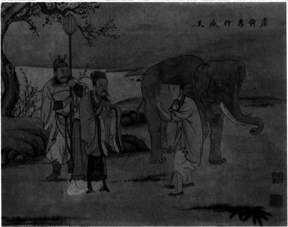
虞舜孝行感天图 清·王素