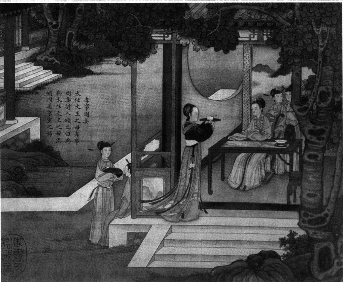
历朝贤后故事图之孝事周姜 清·焦秉贞