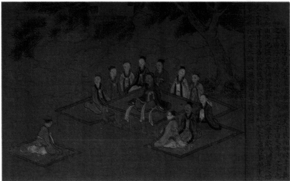
孝经图之开宗明义章 宋·无款

dà yǎ yún wú niàn ěr zǔ “《大雅》云 ① ：‘无念尔祖 ② ， yù xiū jué dé dé ③ 。’” 聿修厥德 ③ 。