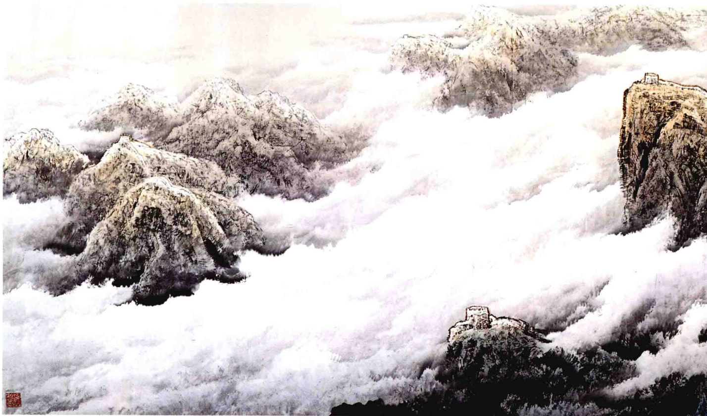
长城颂 503 × 143cm 1997年