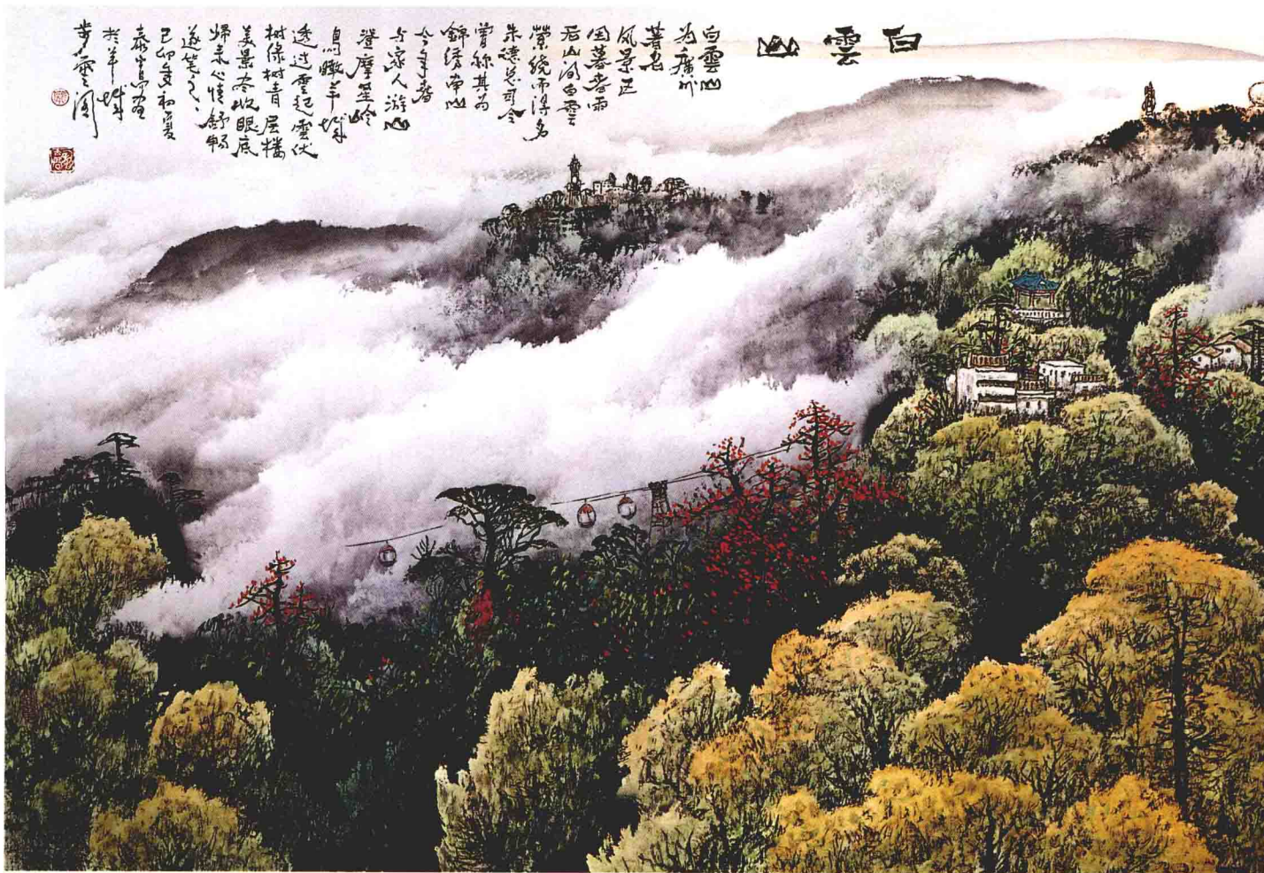
白云山 305 × 95cm 1999年