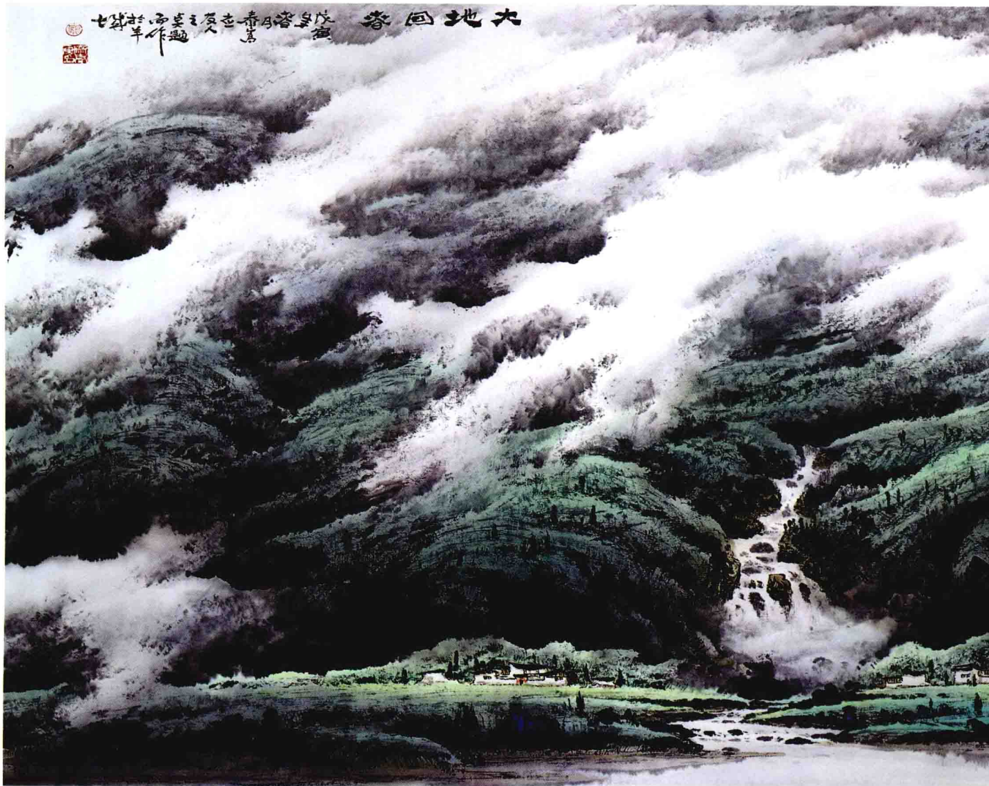
大地回春 248 × 124cm 1998年