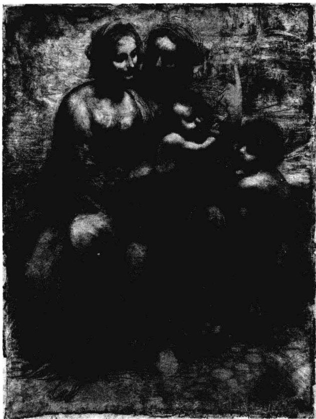
《圣母子、圣安妮与约翰》，达·芬奇，141.5×104.6公分， 1501，伦敦国家画廊

卫》时，几乎没有引起人注意，人们对他在罗马的成就并不关心，连他的父亲也只关心他是否能在家乡成名、赚钱。不知道是否同行相妒，或是缺乏安全感，米开朗琪罗这个小老弟与达·芬奇一上来就不对路，有点剑拔弩张，甚至有过正面冲突。当《大卫》完工后，达·芬奇主张把它放在一个不起眼的地方，免得碍事。幸好委员会没有接受他的建议。