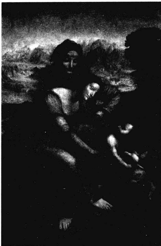
《圣母子与圣安妮》，达·芬奇，168×112公分，1508，卢浮宫