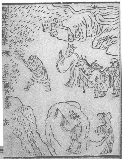
清咸丰本 西游真途行者三调芭蕉扇