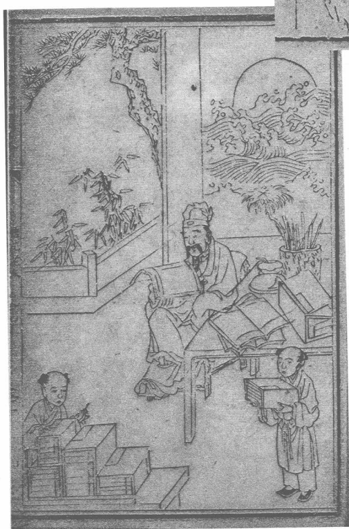
清嘉庆本 悟元老人刘一明像