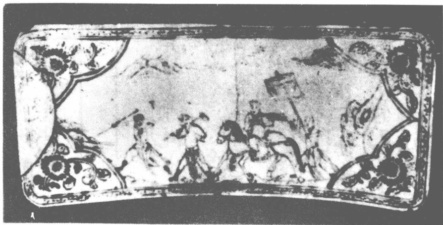
元瓷州窑唐僧取经瓷枕