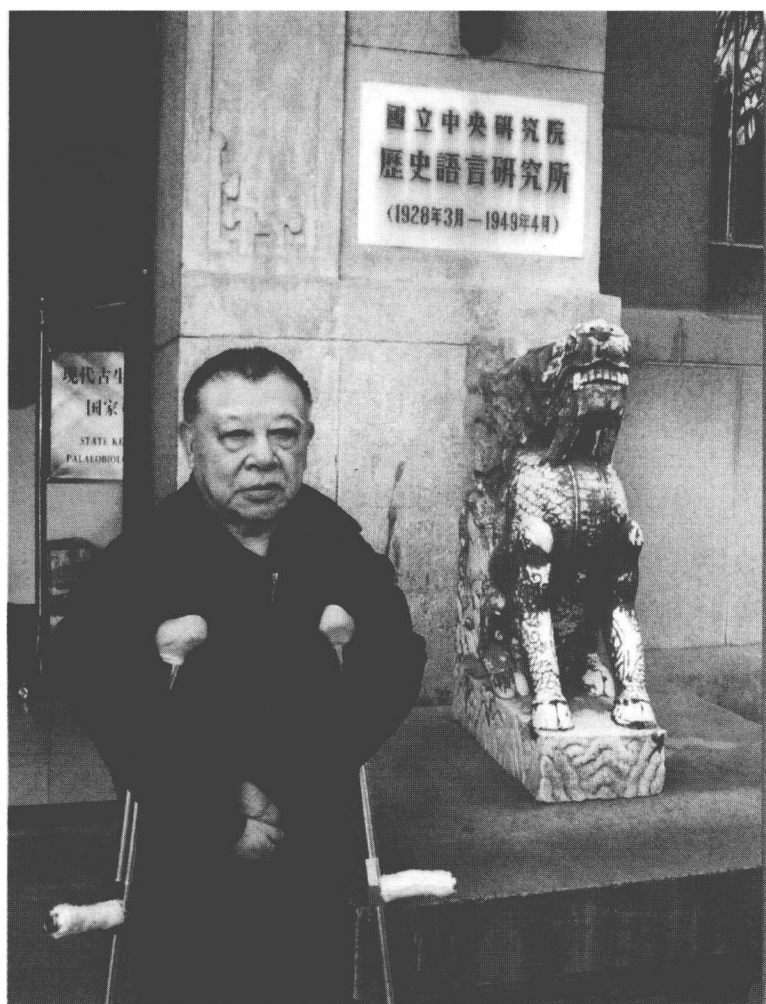
许倬云先生（1930— ）造访南京中央研究院历史语言研究所旧址留影。