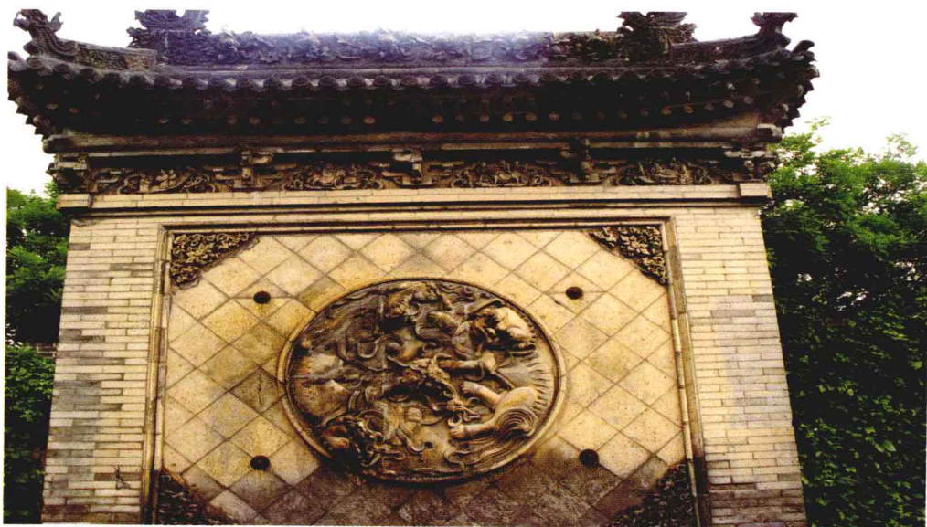
▼ 山西王家大院的影背墙