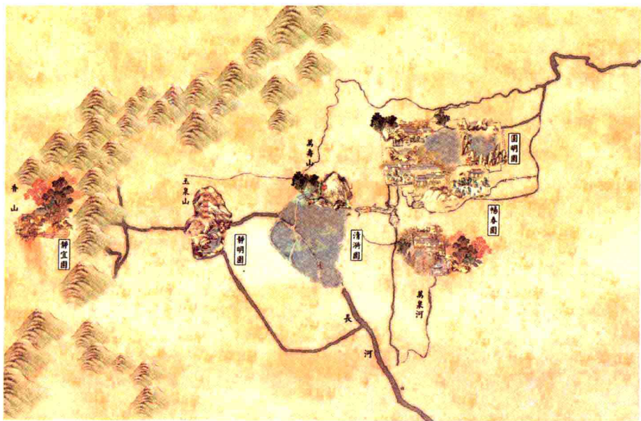
三山五园位置示意图

扩建后的圆明园，占地面积达到3000亩左右。每个景区内，既有庄严宏伟的宫殿，也有使人感觉轻松灵巧的楼阁亭台与回廊曲桥，假山、湖泊以及蜿蜒的河流点缀其中。在雍正朝，圆明园的格局基本完成。