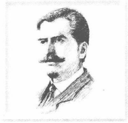
The Beginnings of Art