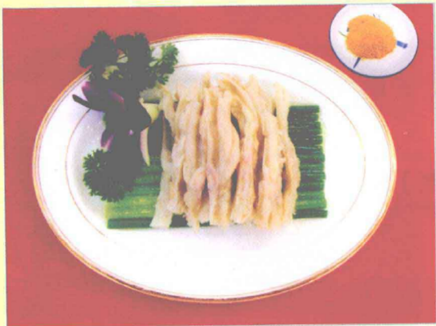
芥末鸭掌 (芥末味型)