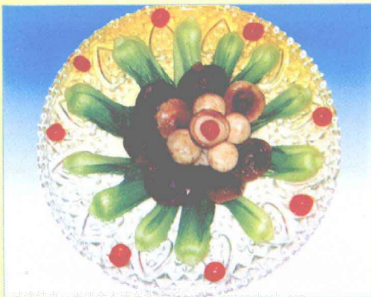
双菇扒菜心 (家常味型)