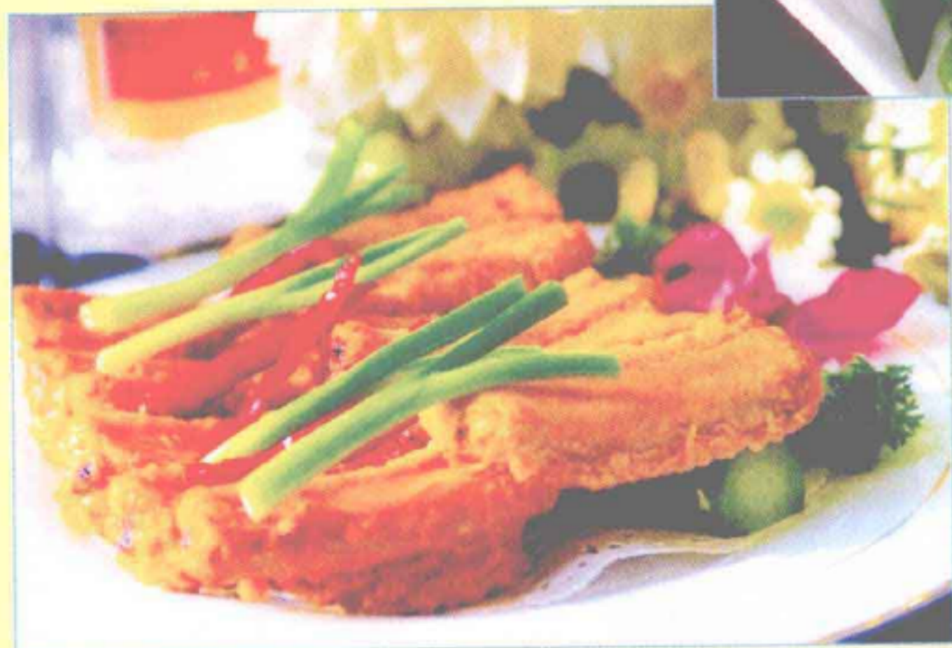
孜然排骨 (孜然味型)