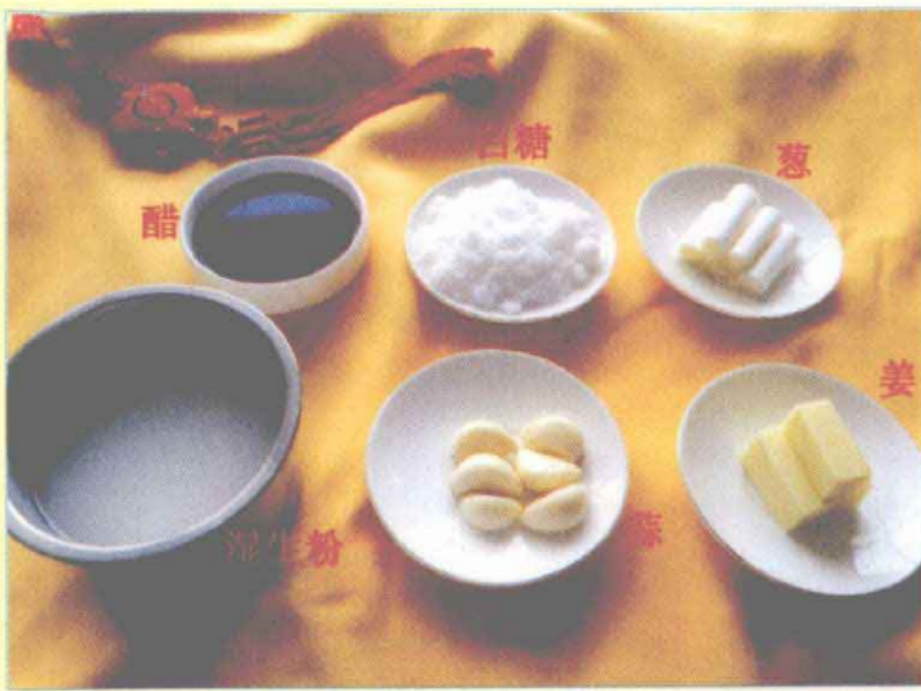
鲁菜糖醋味汁配料