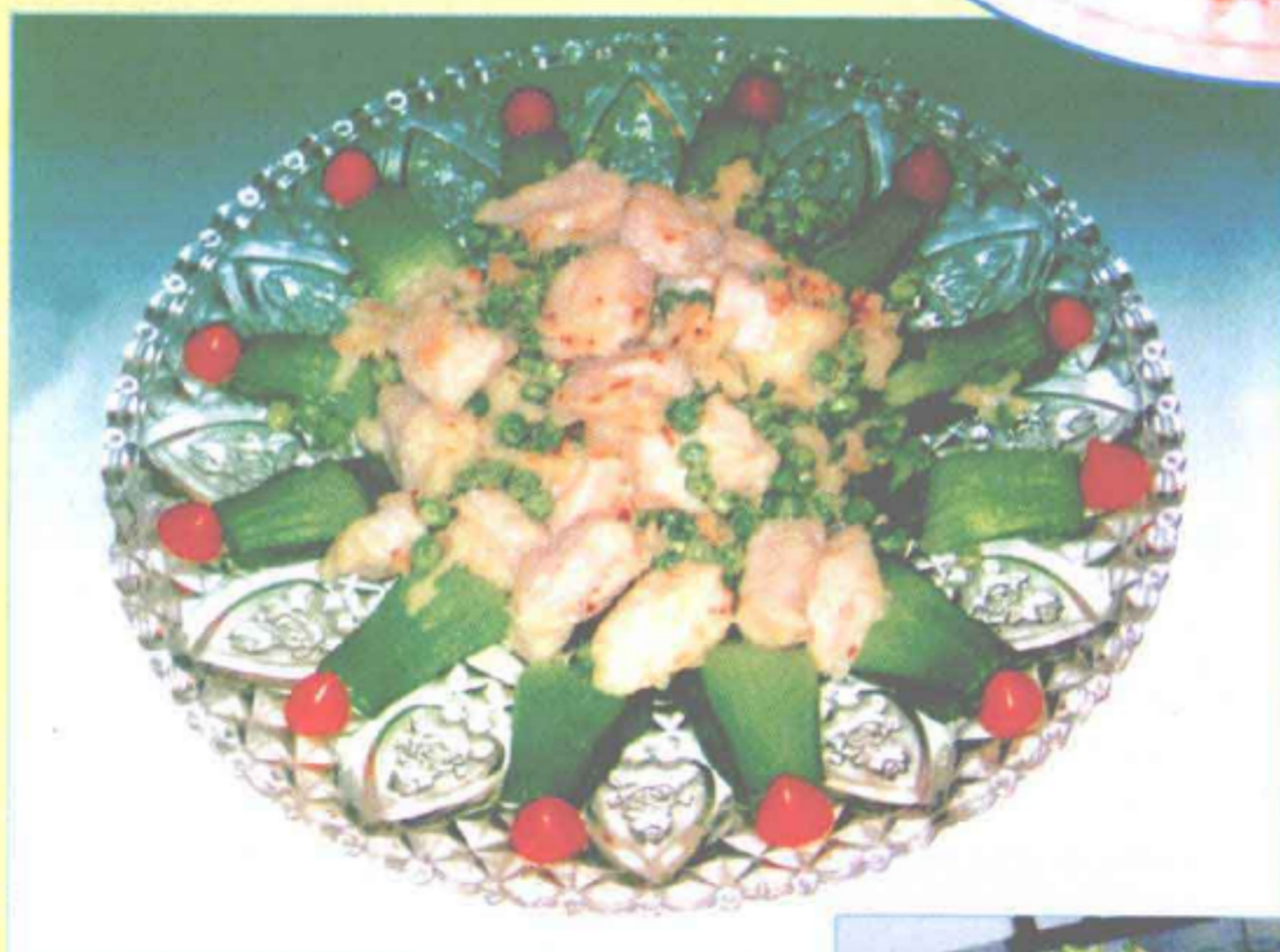
蒜爆里脊 (蒜香味型)