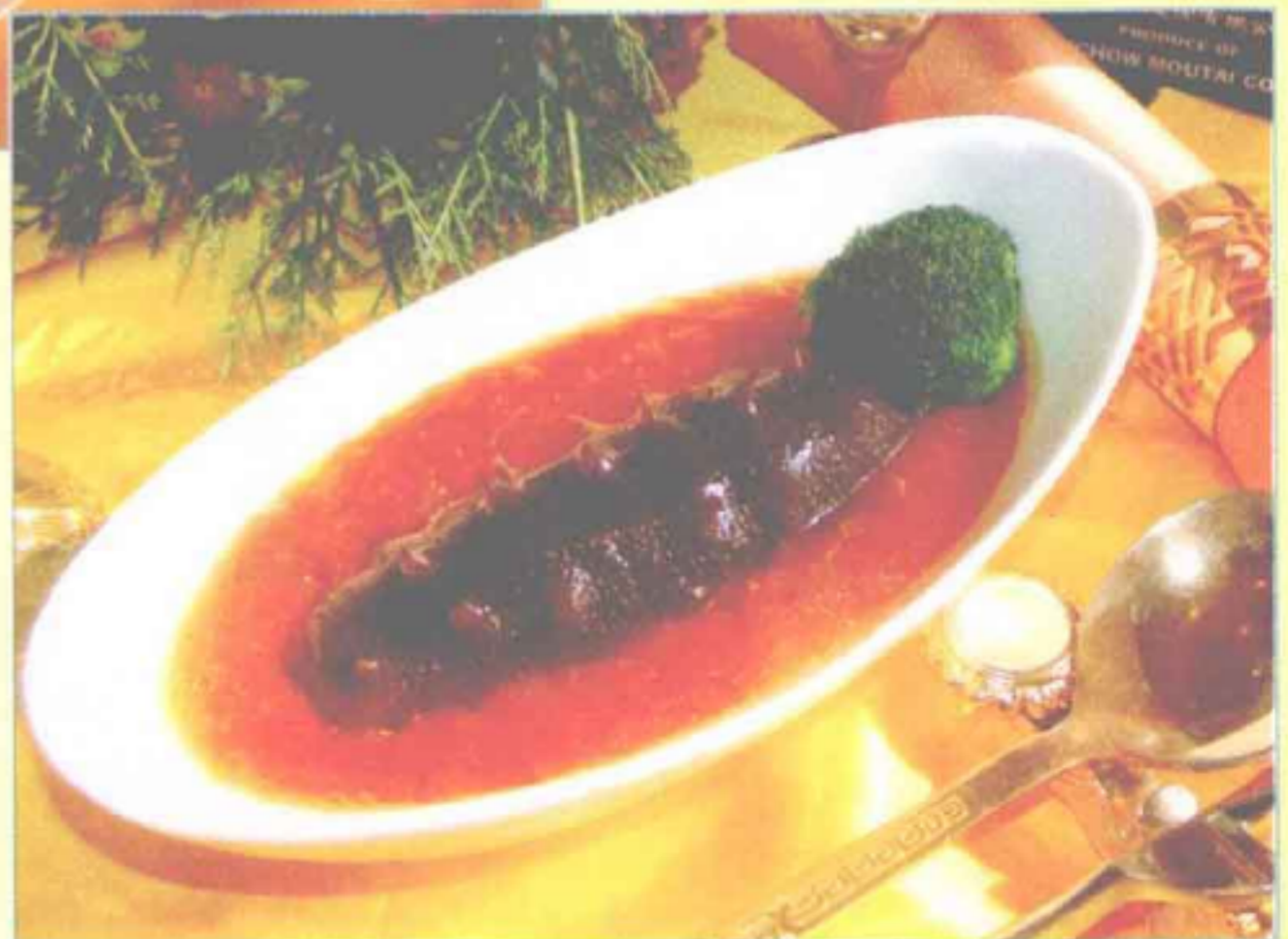
番茄养生参（茄汁味型）