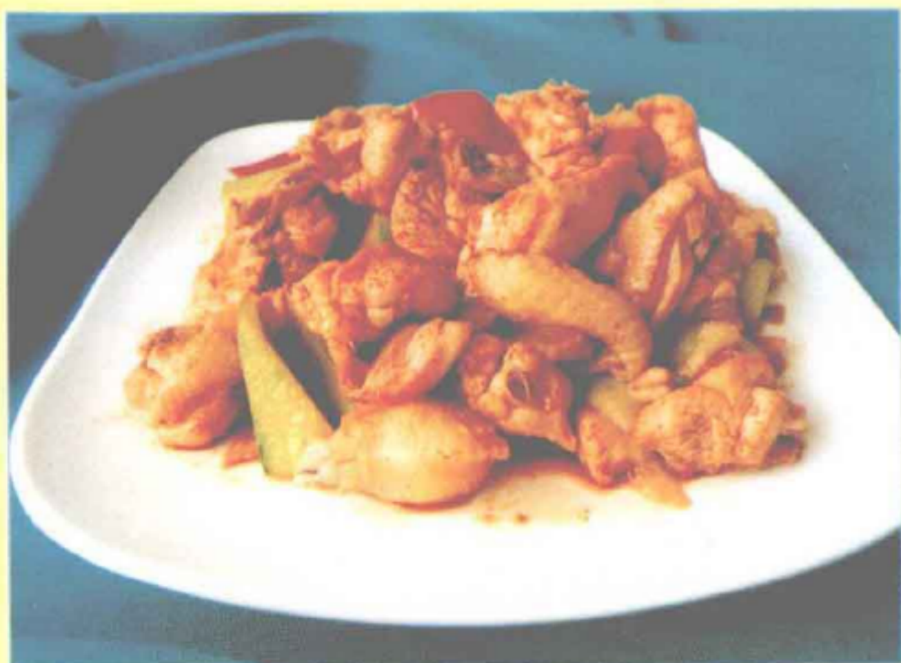
辣鲜露口水鸡（麻辣味型）