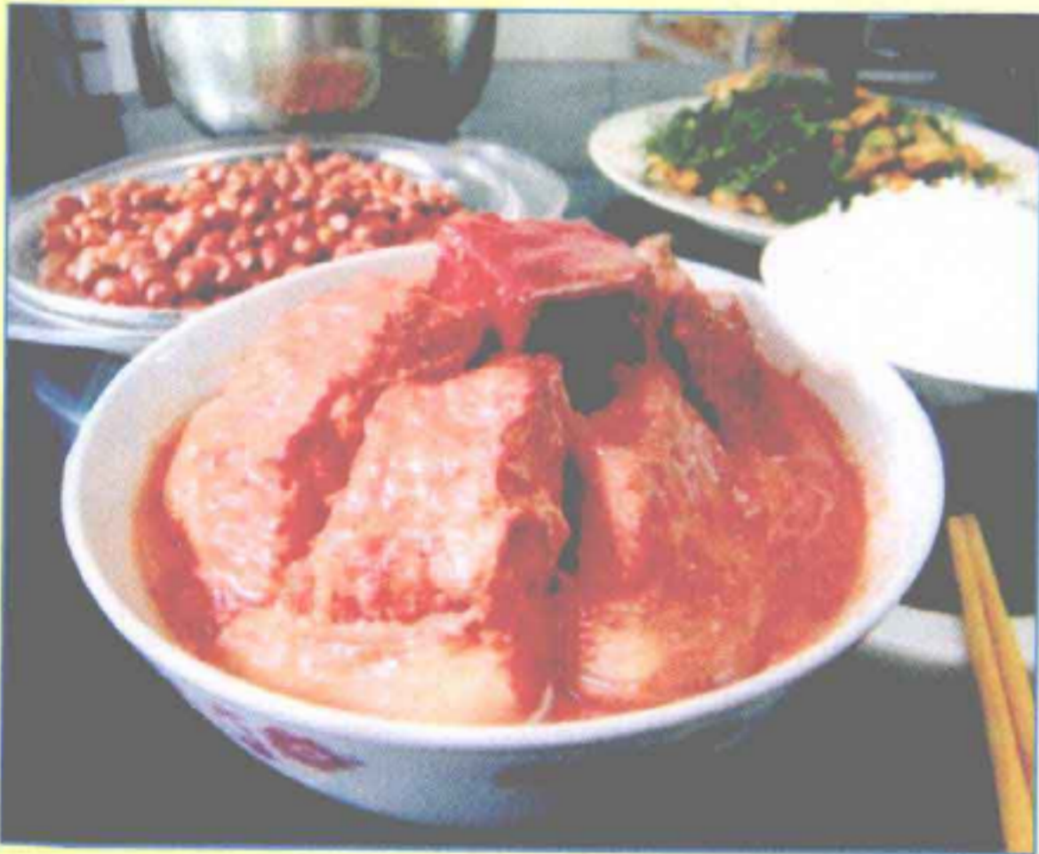
腐乳蒸猪肉(腐乳味型)