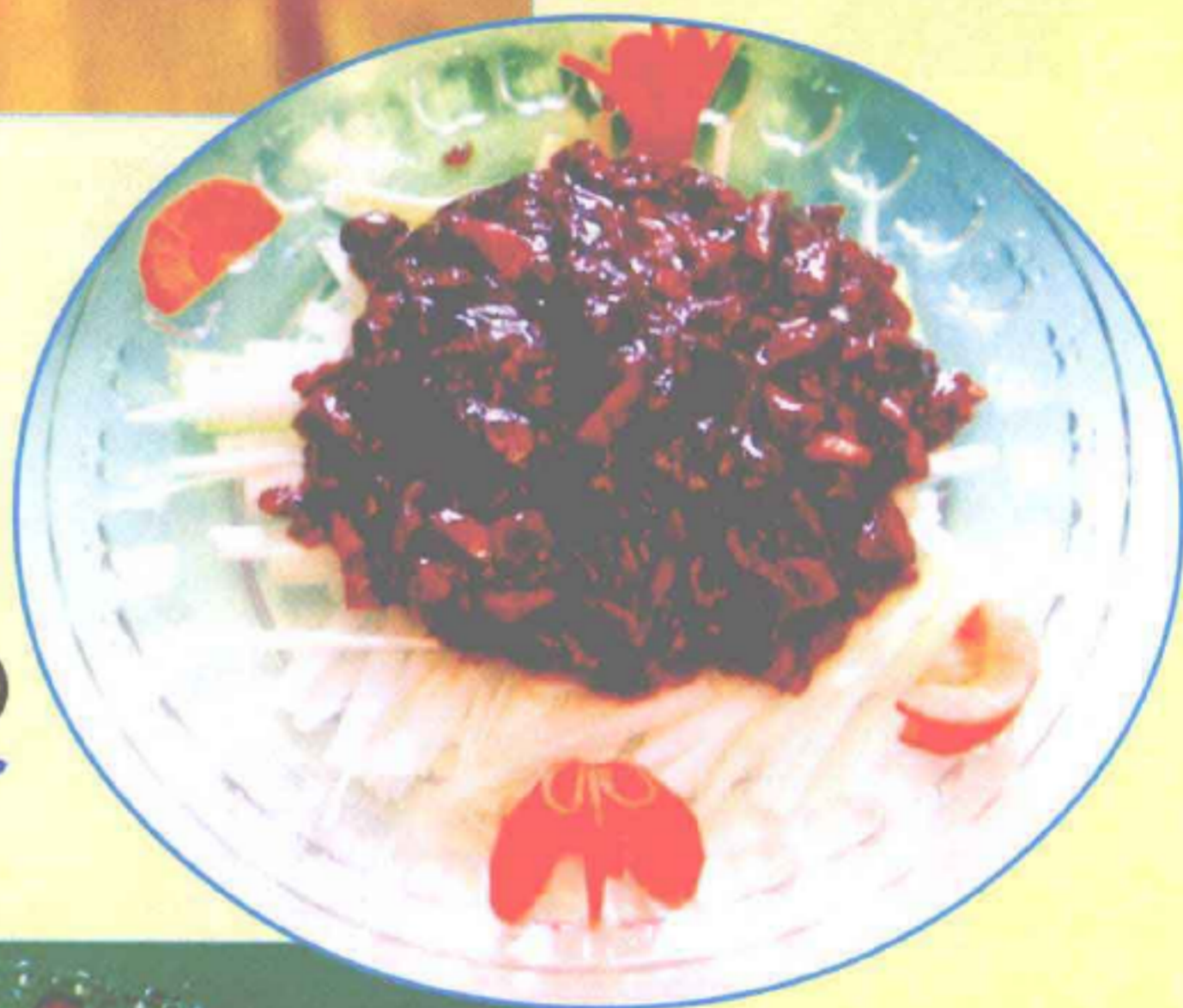
京酱肉丝(酱香味型)