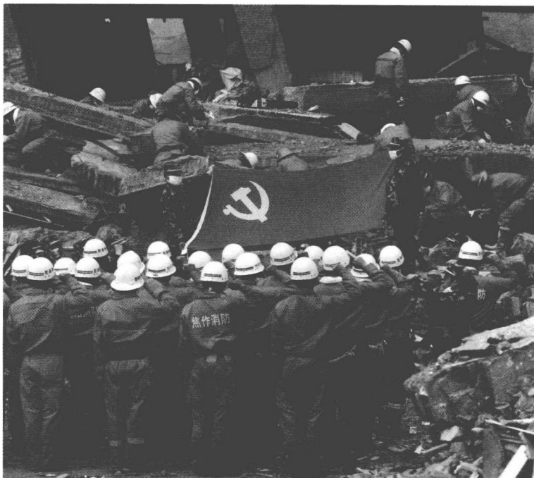
汶川地震中，什邡市救灾现场，河南消防抗震救灾突击队 20 名战士宣誓入党。

极分子。因此，广大党员不仅生活在人民群众中间，而且是人民群众可以信赖的领头人。有个合资企业的外方管理人员就对我说过，他不要调查就可以知道，企业里谁是共产党员，那些认真工作又有业务能力的人，肯定是共产党员。