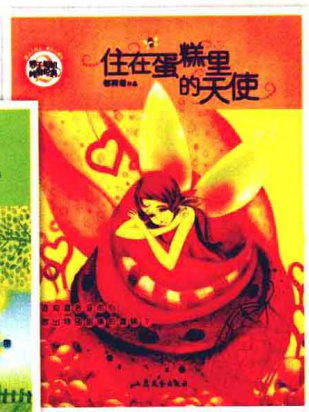
《住在蛋糕里的天使》