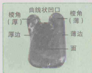
图 1-5 玉制刮痧板