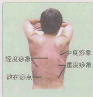
图 1-3 背部痧象