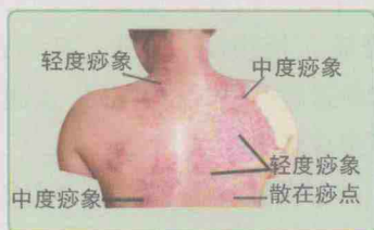
图 1-2 项背部痧象