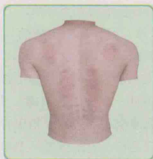
图 1-4 背部痧象退痧